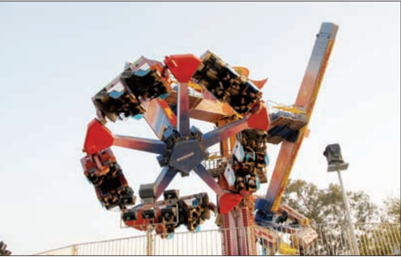
لعبة الإعصار.. مغامرة وترفيه