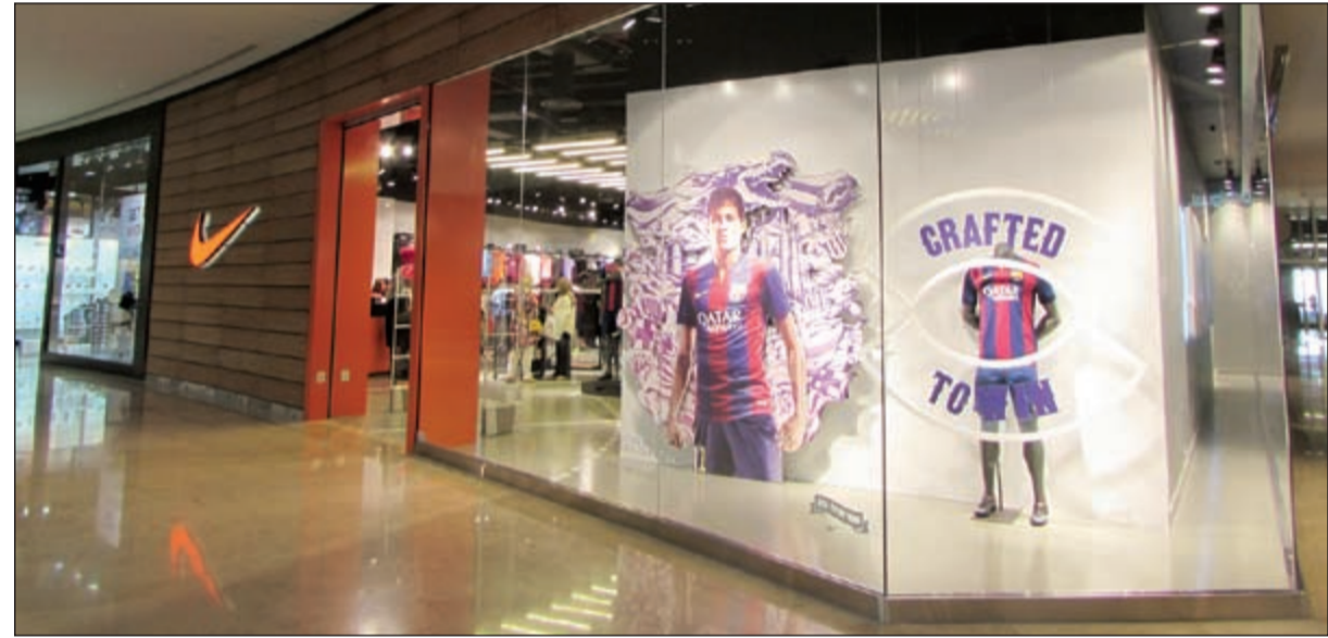
متجر نايك المجدد في مول 360

أعلنت شركة علي عبد الوهاب المطوع التجارية أمس عن كشف الستار عن متجر Nike الرياضي والمتعدد الأقسام في مول 360 والذي تم إعادة تجديده بالكامل مؤخراً، ليمتد على مساحة 370 متراً مربعاً ويضم أقساماً متنوعة تضم الأحذية الرياضية، والملابس والمستلزمات الرياضية، والاكسسوارات.