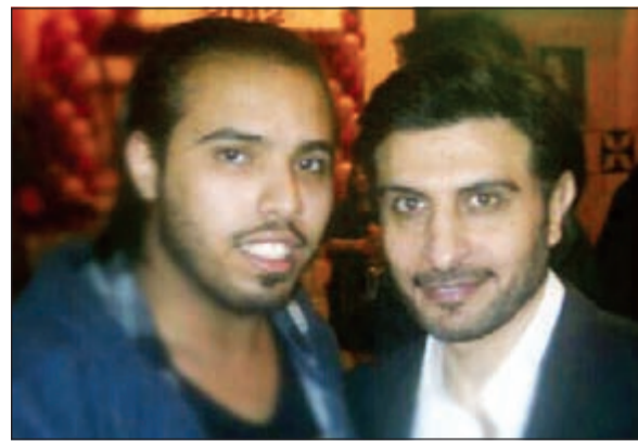
... ومع ماجد المهندس