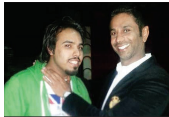
سفير الصداقة وسفير الألمان معا