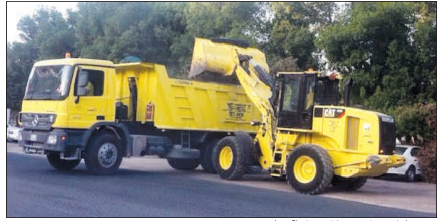
رفع مخلفات من إحدى مناطق محافظة حولي