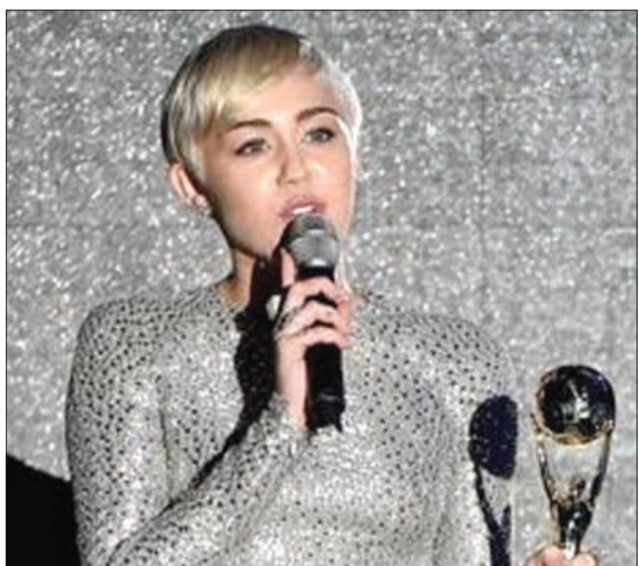
مايلي سايرس تحمل الجائزة

يذكر أن مايلي سايرس مغنية وممثلة اشتهرت في عالم الطفولة باسم هانا مونتاننا، وبدأت بالغناء في عمر 8 سنوات، وحصلت على جائزة أفضل ممثلة مرافقة كوميدية لعام 2007، كما حازت عام 2008 على مكان في قائمة مجلة «التايمز» لأكثر مائة شخصية تأثيرا. وأثارت النجسة الجمهور والصحافة في الفترة الأخيرة، بعد تحولها من نجمة للأطفال إلى عالم الاستعراض الجسدي وذلك من خلال ظهورها في فيديوها مثيرة وتأديتها لأغان مصورة بطريقة مبتذلة ورخيصة.