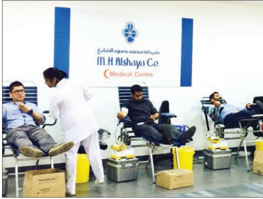
جانب من تبرع موظفي شركة الشايح بالدم

سعداء لتمكننا من استخدام المركز الصحي الجديد في الشركة لاستضافة بنك الدم الكويتي والمساهمة في حملة التبرع. ان دعمنا لهذا البرنامج يعزز من التزام الشركة، إدارة وموظفين، بمسؤوليتها في توفير الدعم للمجتمع».