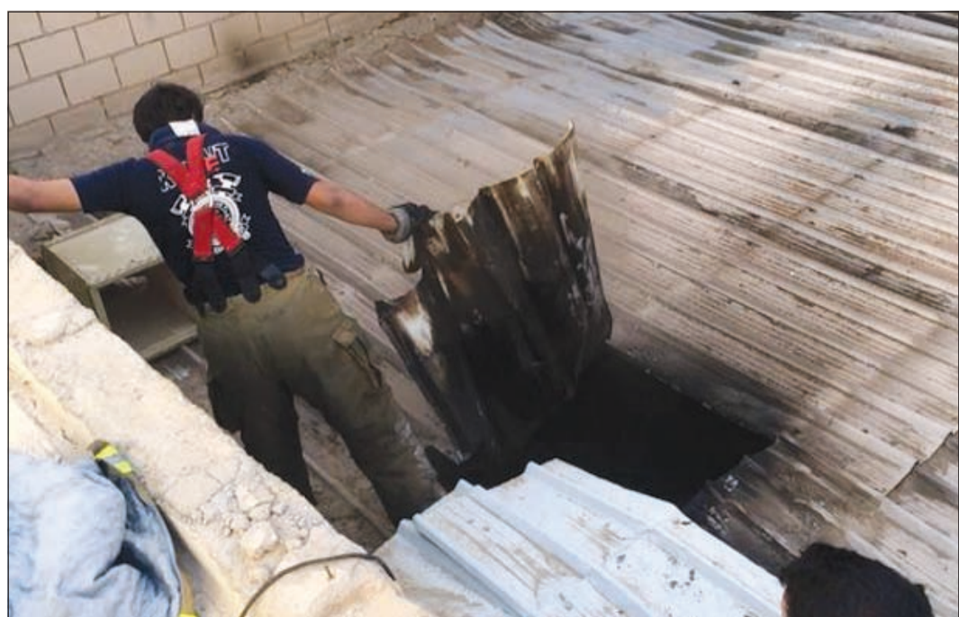
رجل اطفاء خلال مكافحة حريق المطبخ