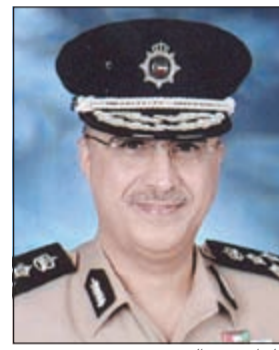
اللواء فرج الشمري

ومساعدة اللواء محمد العنزي ومدير عام المباحث الجنائية اللواء محمود الطباخ وتمت معاينة الموقع الذي اتضح من خلالها أن اللصوص دخلوا المحل من خلال فتحة التكييف، وأما المسروقات فقام بحصرها في البلاغ مدير محل المجوهرات والذي صنفها كالتالي: «عدد 3 شكاكات أطقم كاملة و30 دبلة و8 خواتم وإسورة الألماس و5 أقراط وعدد 5 قلادات وجهان لاب توب وجميع المسروقات من الذهب والألماس». وقال مصدر أمني إن السرقة وكما يبدو تمت