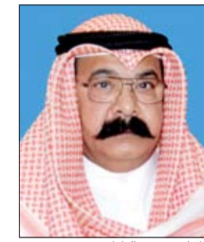
اللواء محمود الطباخ

وفور ورود البلاغ توجه إلى موقع الحادثة مدير أمن الفروانية اللواء فرج الشمري