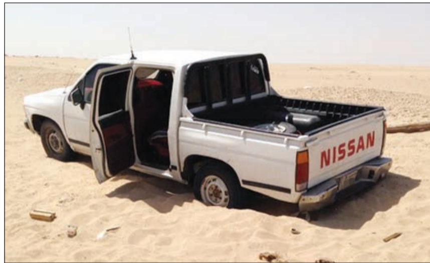
سيارة المواطن كما عثر عليها رجال مخفر تيماء