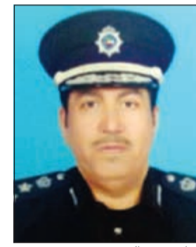
اللواء محمد العنزي