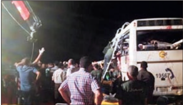
تجمهر أمام الحافلة ومحاوله إخراج الجثث والمصابين