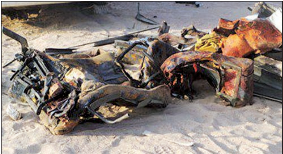
حطام إحدى الحافلتين

الناجمة عن حوادث الطرق في منطقة الشرق الأوسط، حيث بلغ عدد الوفيات في ذلك العام 7115 حالة، بمعدل 8,8 حالات لكل 100 ألف نسمة، وبمعدل 19,5 حالة وفاة يوميا. وترتبط أغلب الحوادث بسوء حالة الطرق، كما يعزى بعضها إلى تهور السائقين وعدم التزامهم بالقواعد المرورية.