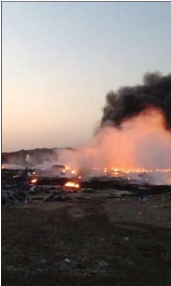
النيران تلتهم إطارات سكراب ميناء عبدالله