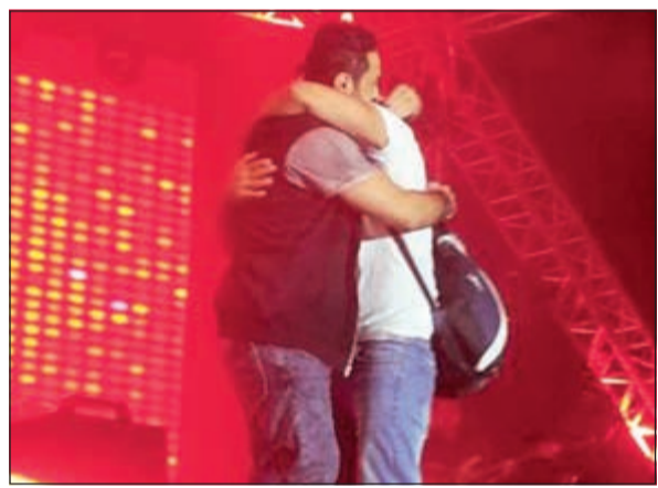
الشاب مقتحماً حفل تامر

التي ذلك، ظهرت الفنانة المعتزلة بسمة بوسيل في كواليس الحفل، فيما أكد البعض أن حضور بسمة ينفي تماماً جميع شائعات الانفصال التي طاردتها الفترة الأخيرة، وتواجدت بسمة في سيارة الفنان تامر حسني بصحبة أصدقائها المقربين، انتظارا لانتهاء تامر من حفلة الغنائي لتغادر معه.