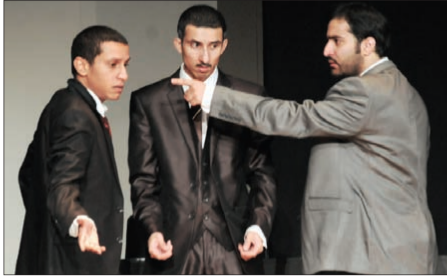
التخطيط لقتل المرأة

فالفنانون المشاركون قدموا أدواراً جديدة عليهم بخلاف مشاركاتهم السابقة بدءاً من الشخلى الذي ترمد على أنواره التقليدية وظهر بشكل «غير» وان طغى حسسه الكوميدي