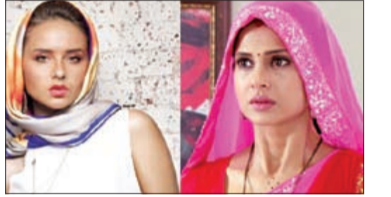
نيللي كريم وجينيفر وينجت

خلقت النجمة الهندية جينيفر وينجت قلوب الجميع بدورها المميز في مسلسل «سحر الأسمر» أمام النجم جوتام رودي من خلال أدائها المميز وإطلالاتها الجذابة ورقتها الساحرة.