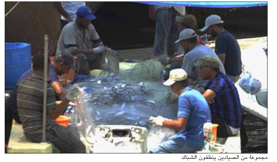
مجموعة من الصيادين ينظفون الشباك