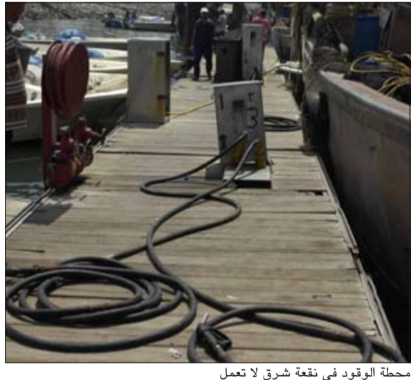
محطة الوقود في نقعة شرق لا تعمل