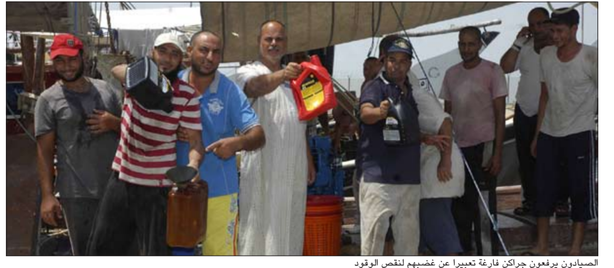
الصيادون يرفعون جراكن فارغة تعبيراً عن غضبهم لنقص الوقود