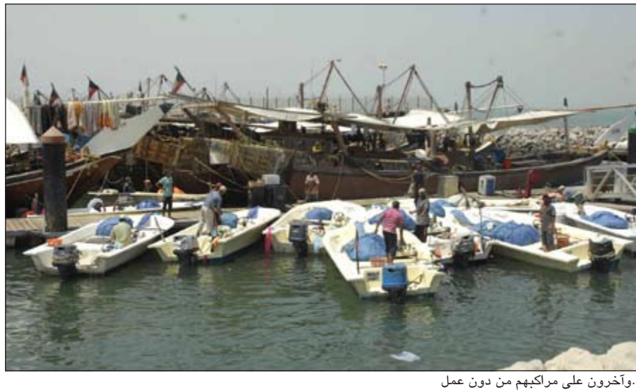
..وأخرون على مركبهم من دون عمل