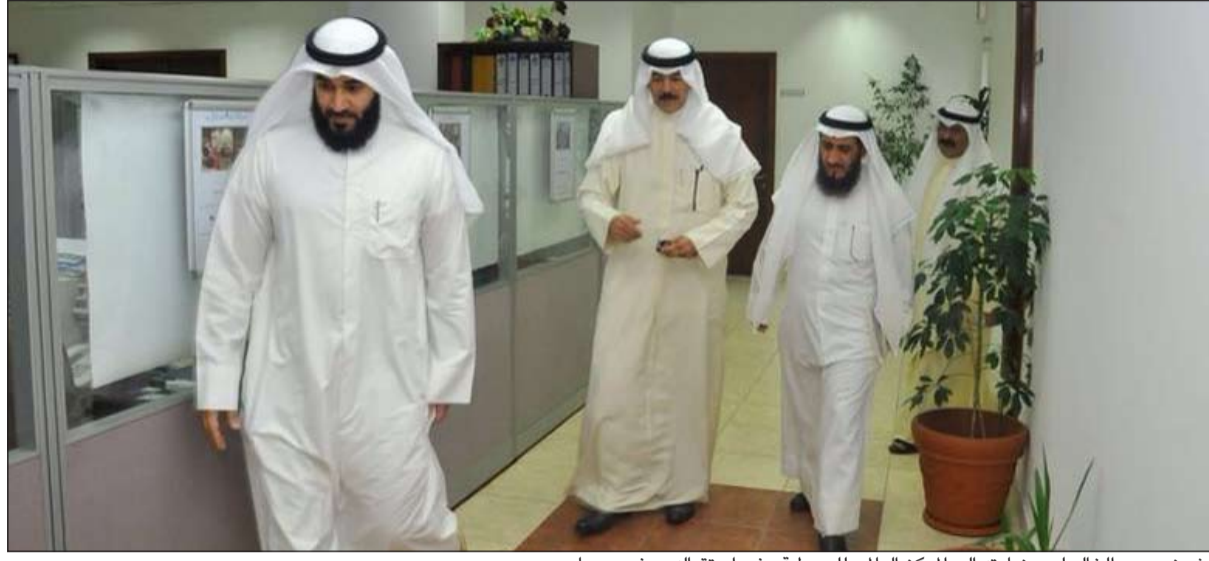
الشيخ محمد الخالد لدى زيارته إلى المركز العالمي للوسطية وفي استقباله م. فريد عمادي

قام نائب رئيس مجلس الوزراء ووزير الداخلية ووزير الأوقاف والشؤون الإسلامية بالوكالة الشيخ محمد الخالد بزيارة تفقدية إلى المركز العالمي للوسطية صباح أمس. وكان في استقباله وكيل وزارة الأوقاف بالوكالة فريد عمادي ومدير إدارة مكتب وزير الأوقاف بدر الضفيري. واطلع نائب رئيس مجلس الوزراء ووزير الداخلية ووزير الأوقاف والشؤون الإسلامية الشيخ محمد الخالد على آلية سير العمل في المركز وهيكلة التنظيمي والأعمال التي قام بها. وفي نهاية الزيارة، قدم الخالد التوجيهات للمسؤولين والقائمين على العمل في المركز بضرورة تحقيق تطلعات رغبة صاحب السمو الأمير الشيخ صباح الأحمد بأن تكون الكويت منارة تقتبس من نورها الدول والشعوب الأخرى منهج الوسطية والاعتدال والتسامح التي حث عليها ديننا الحنيف، وذلك عن طريق التعاون بين جميع مؤسسات الدولة لتحقيق الأهداف التي أنشئ من أجلها المركز، وكذلك ضرورة مضاعفة الجهود في نشر الوسطية والاعتدال ونبذ الغلو والتطرف في المجتمع الكويتي.