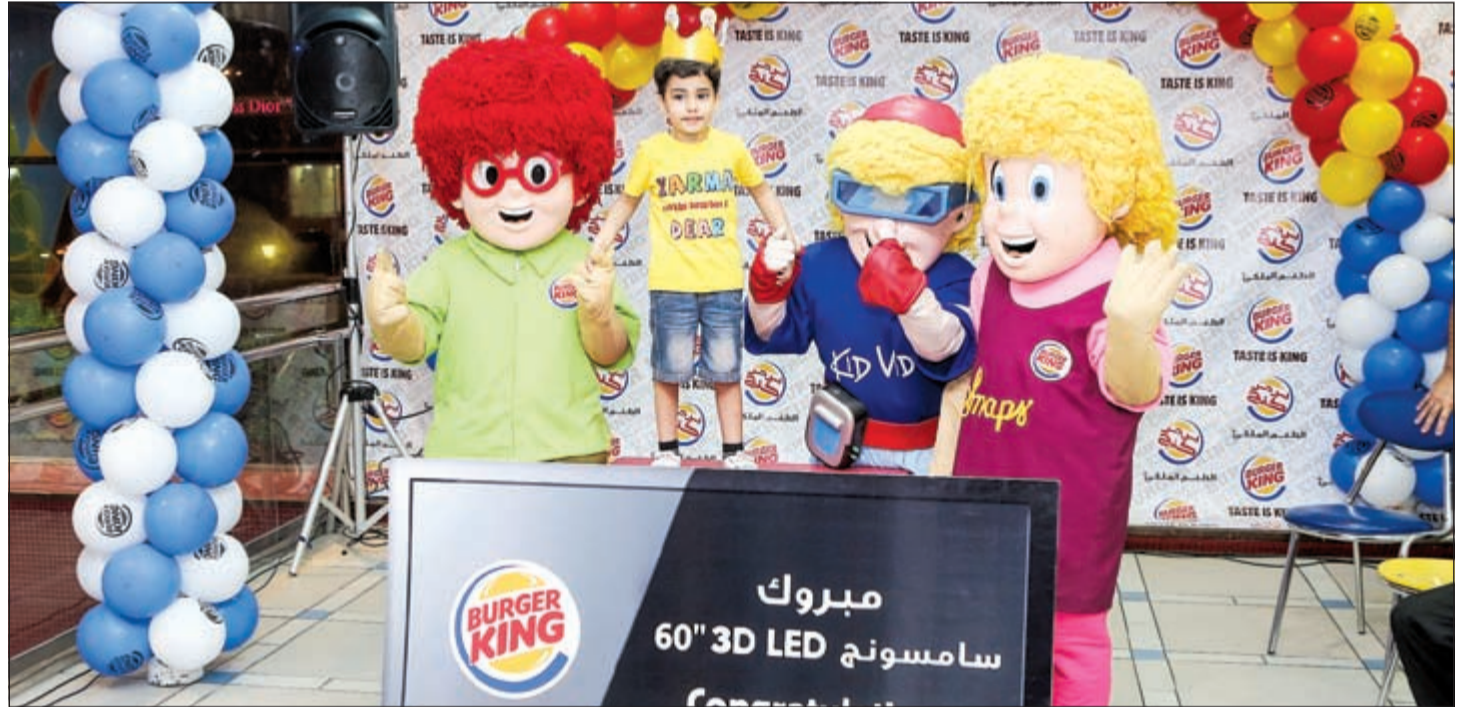
جانب من الحفل وإعلان الفائزين

في إطار اهتمامها بتوفير أجواء ترفيهية للعملاء وحفاظا منها على التواصل الفعال معهم، نظمت برجر كنج، مسابقة خاصة مستوحاة من أجواء كأس العالم عبر مواقع التواصل الاجتماعي. أتت المسابقة التي شهدت مشاركة كثيفة، بمنزلة طريقة خاصة للاحتفال مع العملاء بهذا الحدث الذي ينتظره الملايين بشغف حول العالم. طلب من كل مشترك تصوير «سيلفي» مع الكأس التي تحمل اسم فرقة المفضل. وكان قد جرى توزيع هذه الكؤوس المميزة لدى طلب الوجبة الكبيرة، التي لاقت إقبالا كبيرا من محبي سندويشات برجر كنج المميزة من كل مكان في الكويت. وفق شروط المسابقة،