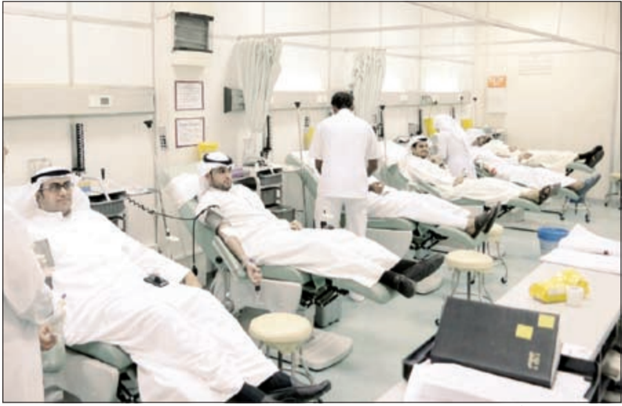
موظفو «التجاري» أثناء تبرعهم بالدم