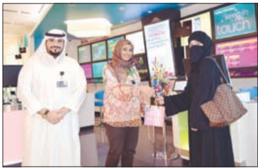
مسؤولو الشركة أثناء تكريم إحدى الفائزات

رمضان لعام 1435، بالإضافة لجدول شامل يتضمن أسماء المساجد التي تقام بها صلوات التراويح والقيام في العشر الأواخر من رمضان حسب جداول وزارة الأوقاف الرسمية. وأضافت الشركة أن النسخة الجديدة من التطبيق شملت الحلقات الروحانية الحصرية والتي تم عرضها يوميا بالتعاون مع الشيخ طلال فاخر، حيث تضمنت مختلف المواضيع الإسلامية والنصائح والمواظب الهامة التي أجابت عن تساؤلات الجمهور خلال الشهر الكريم والمتعلقة بالصيام والحكمة، وإمساقية شهر