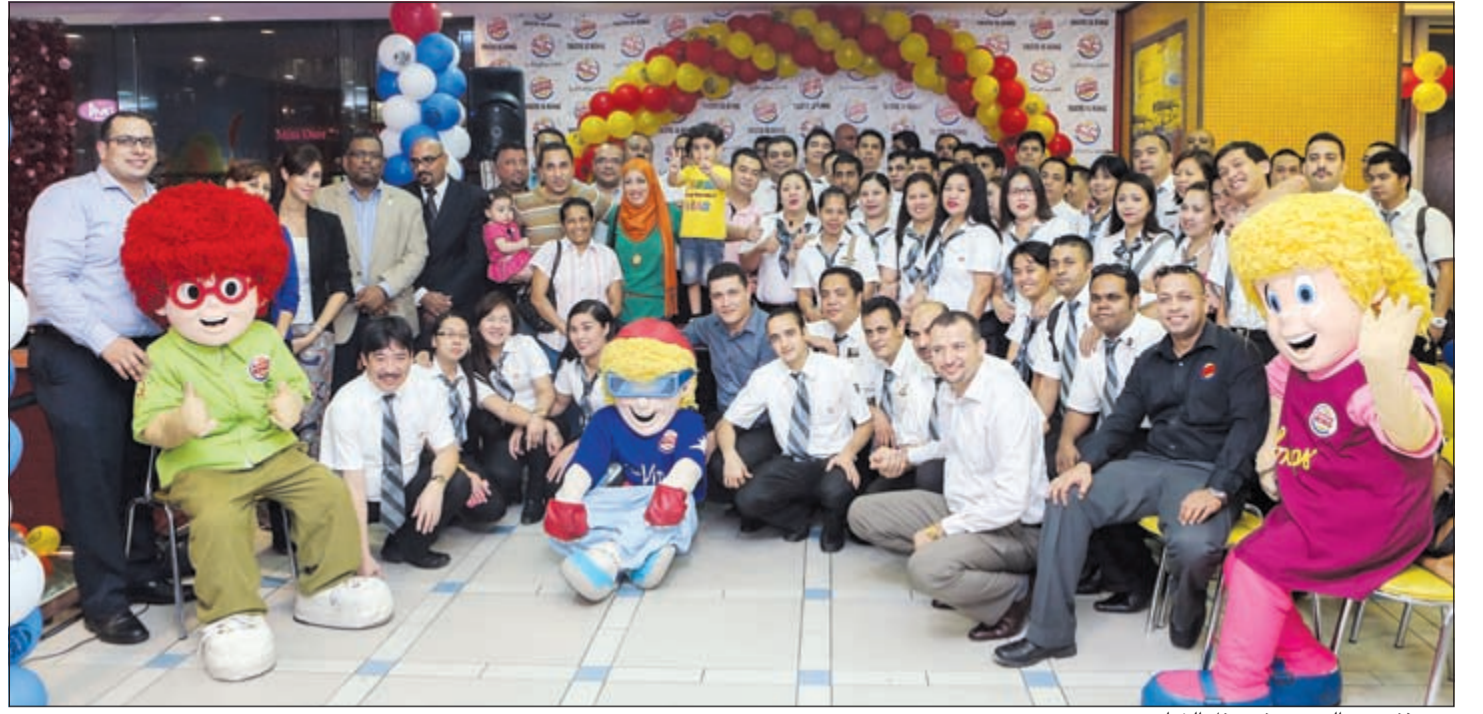
جمع غير من الحضور في حفل الختام