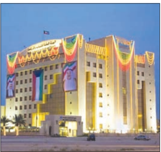
«الشباب والرياضة» داعم رئيسي للمواهب والطاقات الشبابية