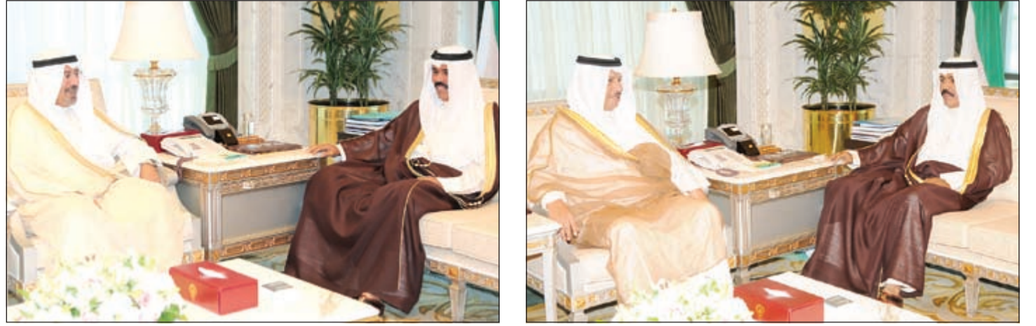
سمو نائب الأمير وولي العهد الشيخ نواف الأحمد مستقبلاً سمو نائب الأمير مستقبلاً الشيخ د. محمد الصباح