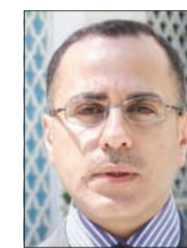
السفير جمال الغنيم

الشؤون الإنسانية بذلك التبرع بتصريح لـ «كونا» ان هذا التبرع يواكب سياسة الكويت في اهتماماتها بدعم برامج التنمية المستدامة في أفريقيا لإسبما ان الكويت تتنافس القصة العربية - الافريقية حاليا. وأضاف ان الكويت لم تغفل يوماً المشكلات الإنسانية التي تمر بها القارة وكانت سباقة في دعمها في مجالات مختلفة.