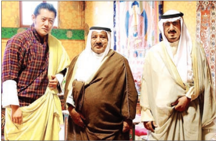
وزير شؤون الديوان الأميري الشيخ ناصر صباح الأحمد خلال لقائه مع الملك الأب بمملكة بوتان

اجتمع وزير شؤون الديوان الأميري الشيخ ناصر صباح الأحمد مع ملك مملكة بوتان الملك الاب الرابع جيغمي كيزار نامجيل وانجشوك في العاصمة (تيمفو) بحضور رئيس الوزراء البوتاني تشريك توبايكي. ونقل الشيخ ناصر صباح الأحمد للملك الأب تحيات صاحب السمو الأمير الشيخ صباح الأحمد حيث ترتبط مملكة بوتان بعلاقات تاريخية مع الكويت تقوم على الاحترام المتبادل والمصالح المشتركة التي تخدم البلدين الصديقين. وحضر المقابلة القائم بالأعمال لدى سفارتنا بمملكة بوتان المستشار يوسف المسكتي.