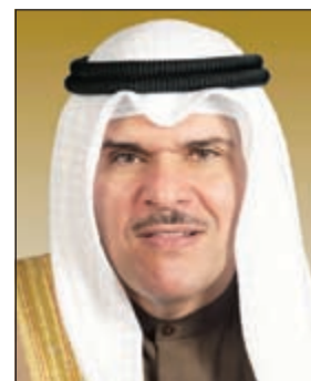
الشيخ سلمان الحمود

بحث وزير الإعلام ووزير الدولة لشؤون الشباب ورئيس اللجنة الدائمة للاحتفال بالأعياد والمناسبات الوطنية الشيخ سلمان الحمود ومحافظ حولي الفريق أول متقاعد الشيخ أحمد النواف ومحافظ العاصمة الفريق متقاعد ثابت المهنا، التحضير لمناسبة تكريم صاحب السمو الأمير في الأمم المتحدة كقائد إنساني في سبتمبر المقبل.