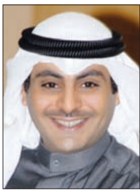
الشيخ أحمد مشعل الأحمد

المشاريع الكبرى في مواعيدها المعلنة مسبقاً. هذا، ويحدد المرسوم رقم 346 لسنة 2007 الخاص بإنشاء جهاز متابعة الأداء الحكومي والذي يشرف على أعماله سمو رئيس الوزراء أن من ضمن مهام الجهاز متابعة الموقف التنفيذي للمشروعات الحكومية داخل كل وزارة أو جهة حكومية بالتنسيق مع هذه الجهات وفي ضوء البرنامج الزمني المعتمدة للتنفيذ وعرض المقترحات اللازمة على الوزير المختص للإسراع في إنهاء هذه المشروعات. على صعيد متصل، نفت مصادر رفيعة وجود «انتقائية» في قرارات المجلس بسحب الجناسي ممن قدموا أوراقاً غير صحيحة أو نفذوا أعمالاً تضر بمصلحة البلاد، مؤكدة أن مثل هذه القرارات تحتاج إلى بحث وتخصيص متأنين قبل إصدارها لضمان الدقة.