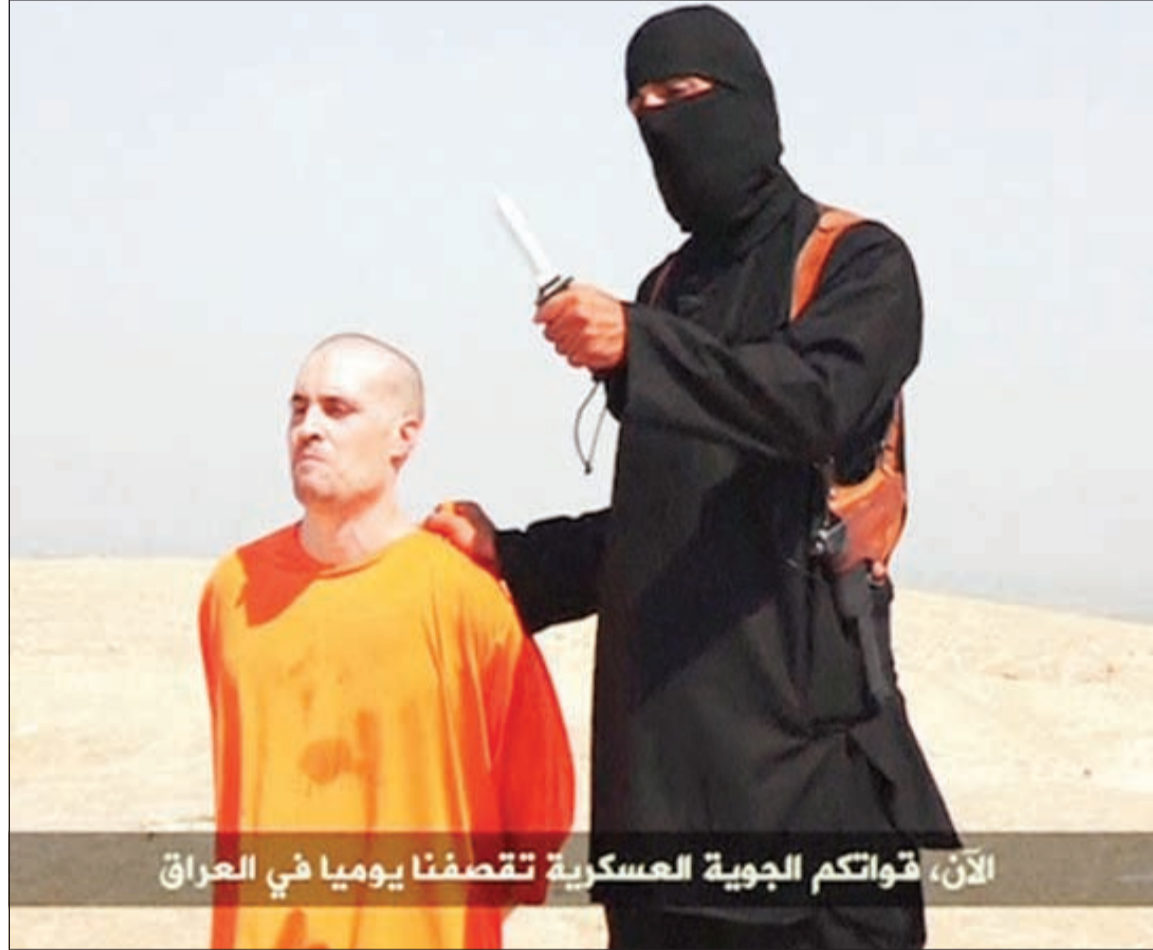
صورة مأخوذة من الفيديو الذي بثه «داعش» المثلث يرفع سلاحاً أبيض قبل ذبحه الصحافي الأميركي جيمس فولبي

عواصم - وكالات: تحت عنوان «رسالة إلى أميركا» نشر تنظيم الدولة الإسلامية في العراق والشام (داعش) فيديو لقطع رأس الصحافي الأميركي جيمس فولبي الذي خطف في سورية في نهاية 2012، مهدداً بقتل الرهينة الأخرى الصحافي الأميركي ستيفن جويل سوتولوف، إذا لم يوقف الرئيس الأميركي باراك أوباما الضربات الجوية الأمريكية في العراق. وفي أول رد فعل من جانبه، أكد الرئيس الأميركي باراك أوباما على ضرورة أن تعمل شعوب وحكومات الشرق الأوسط من أجل استئصال سرطان تنظيم الدولة الإسلامية في العراق «داعش» من المنطقة، مشيراً إلى أنه ليس لداعش مكان في القرن الـ 21. وقال أوباما في بيان أمس تعقيباً على ذبح فولبي في العراق: إن «داعش» يقترب من إبادة جماعية وليست لديه عقيدة أو حس إنساني. وأكد أوباما أن بلاده ستبذل قصارى جهدها وبالتعاون مع حلفائها من أجل إحقاق الحق والقضاء على «داعش».