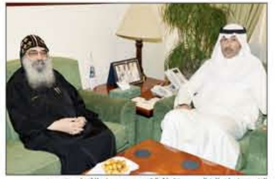
الشيخ فواز الخالد مستقبلاً القمص بيجول الأنبا بيشوي

استقبل محافظ الأحمدى الشيخ فواز الخالد في مكتبه بديوان عام المحافظة راعي كنيسة القمص بيجول الأنبا بيشوي، الذي قدم له التهانئ والتبريكات لتقبل ثقة القيادة السياسية الرشيدة وتولييه مهام ومسؤولية محافظة الأحمدى، متمنياً له دوام التوفيق والسداد في أداء مهمته الجديدة وتحقيق الأمل المنشود لأبناء المحافظة وتسريع إيقاع العمل المتناغم بما يحقق النهوض والتطوير والتنمية للمجالات كافة. وخلال اللقاء أكد الخالد أن الكويت أرض خصبة للتعايش الأخوي وشعبها يتسم بالألفة والمحبة وتعد بمنزلة واحة الأمان والتسامح الديني والمذهبي الأصيل، ولن نتوانى أبداً في بذل المزيد من الجهود للمساهمة في التقارب والترابط مع مختلف الفئات والأديان والمذاهب، منتبهاً على جهود الكاتدرائية المصرية بالكويت البناءة في ترسيخ مبدأ التسامح والمحبة والسلام والتقريب بين أتباع الديانات المختلفة.