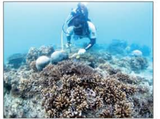
أحد أعضاء الفريق يعاين الشعاب المرجانية في «قاروه»

أظهر مشروع فريق الغوص التابع للمبرة التطوعية البيئية المعنى بمراقبة ورصد حالة المرجان في جزيرة قاروه نتائج إيجابية لحالتها متمثلة بازدهار الشعاب وكثافتها العالية في نمو المستعمرات المرجانية وتنوعها وعودة ألوانها الزاهية إليها.