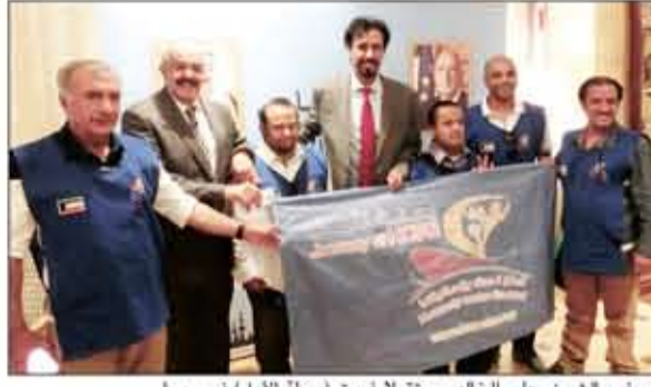
السفير الشيخ علي الخالد مستقبلاً فريق «رحلة الأمل» في روما

رفعت علم الكويت عاليا مبرزا إسهامها الواسع في مواكبة الجهود الدولية بكل أشكال التحديات المشتركة وخاصة ذات البعد الإنساني بفضل الاهتمام والرعاية التي يوليها صاحب السمو الأمير الشيخ صباح الأحمد. وأكد الخالد الذي سيستقبل قارب رحلة الأمل في باليرمو عاصمة جزيرة صقلية الإيطالية مع عمدتها ورئيس الأقليم بعد غمد على إنجازات أصحاب الإعاقات من أبناء الكويت بنفقهم في مجال الرياضة العالمية بما حققوه من جوائز وشهادات رفعت اسم الكويت