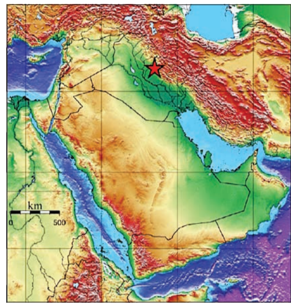
النخمة على الخريطة تمثل موقع الزلزال الرئيسي