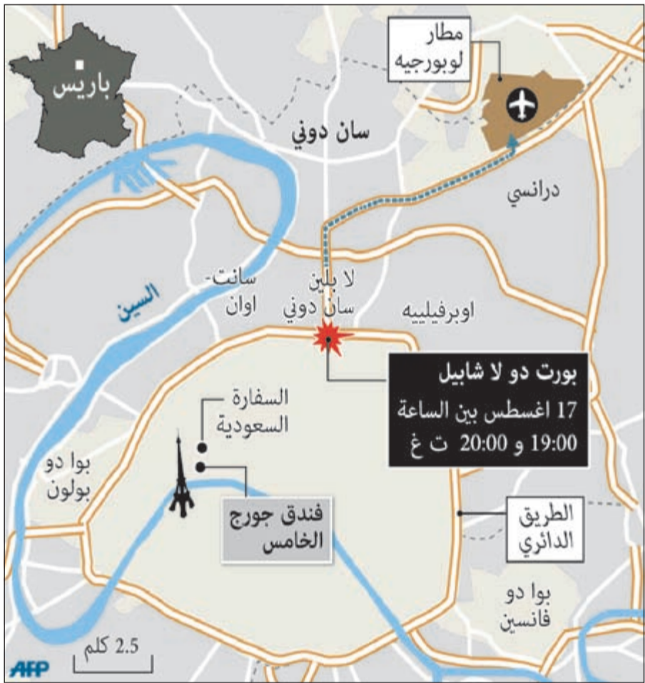
رسم جغرافيك يوضح خط سير حادث السرقة الذي تعرض له المواطن السعودي

مجموعة كوماندوس مسلحة سرقت 250 ألف يورو قبل أن تلوذ بالفرار. وبحسب التقارير أن الموكب كان مؤلفا من عدة سيارات متوجهة إلى مطار لوبورجيه على بعد 15 كلم شمال العاصمة الفرنسية عند تعرضه لهجوم بين الساعة 21:00 و22:00 (20:00 ت غ) عند خروجه من باريس في منطقة بورت دو لا شابيل. وأفاد مصدر في الشرطة بأن «الخسائر المعلنه (بلغت) 250 ألف يورو» ولم يصب احد بجروح.