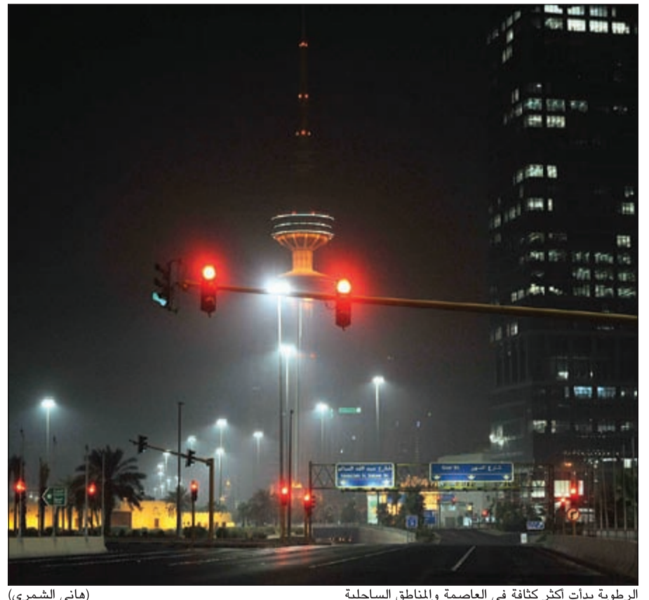
الرطوبة بدأت أكثر كثافة في العاصمة والمناطق الساحلية

سهيل فإن هذا يدل على بشري ان الأمطار لهذا العام ستكون وفيرة». وأضاف العجيري: «هو مجرد توقع ونتمنى أن تكون هذه السنة ستة خير من حيث وفرة الأمطار». وحول توقعه استمرار موجة الرطوبة قال العجيري: «تستمر الرطوبة حتى اليوم (الثلاثاء) والأربعاء تنقشع موجة الرطوبة وبعدها يعود الجو حارا نسبيا وتنكسر حدة الرطوبة خلال عطلة نهاية الاسبوع على ان تعود مجددا الاسبوع القادم».