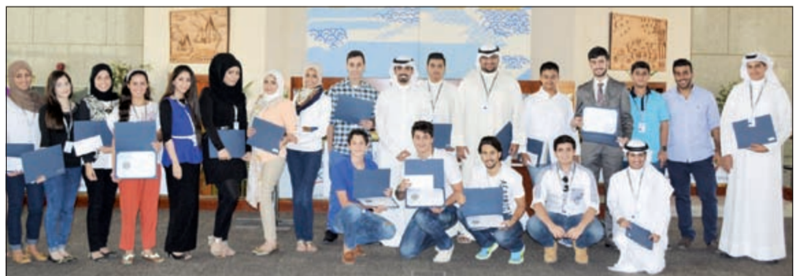
خريجو إحدى دورات برنامج تدريب طلبة المدارس الصيفي 2014