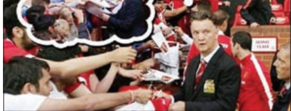
فان غال.. الوجه الآخر لمويس

وتكررت الأخطاء الدفاعية من جانب ليفربول وازدادت عشوائية تمريراته مقابل تنظير دفاعي وهجومي من جانب ساوثمبتون، واستغل الأيرلندي الشمالي ستيفن ديفيس واحدة منها وسدد كرة