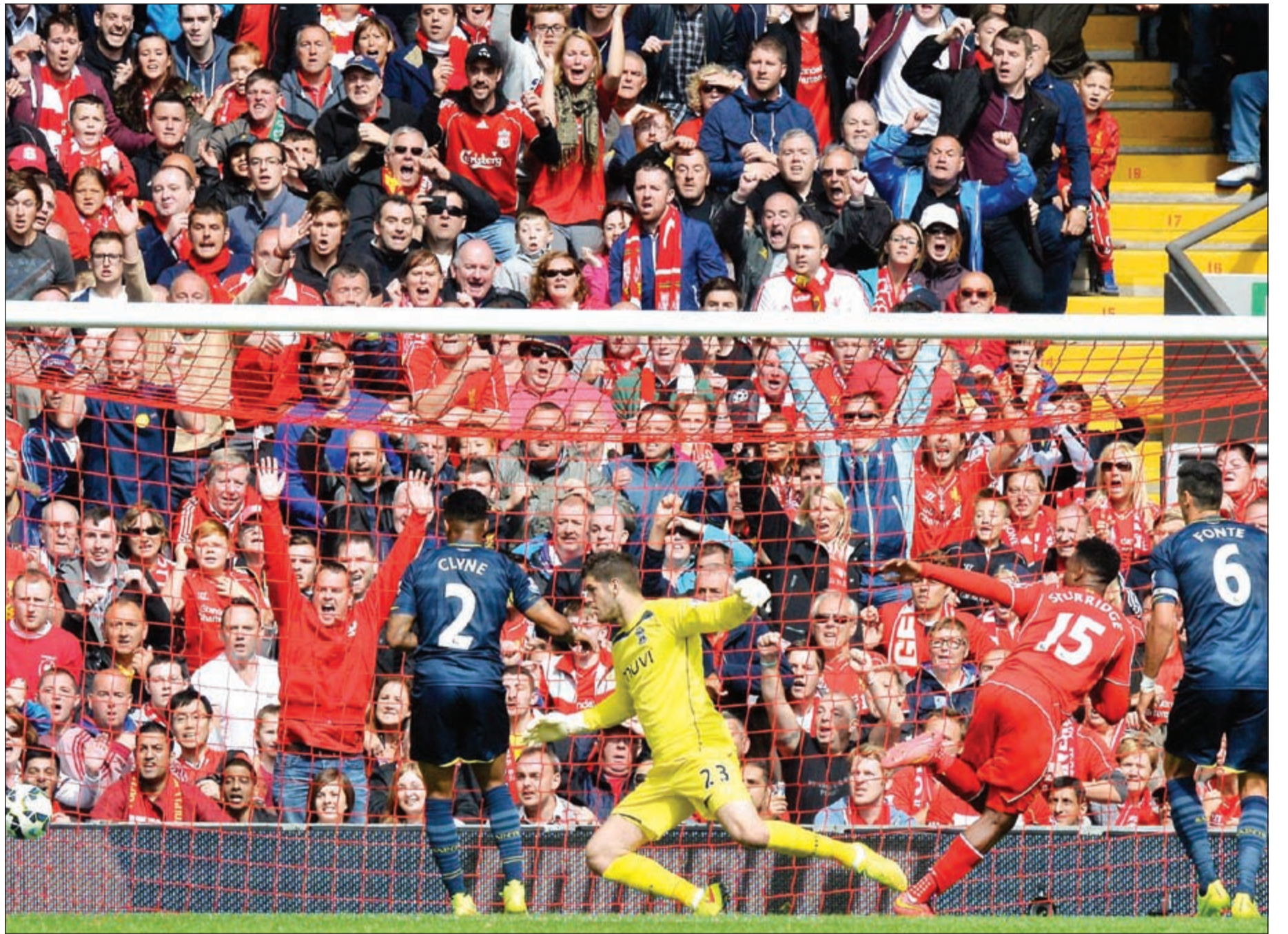
كرة دانيال ستورديج في طريقها لهز شبك ساوثمبتون

يذكر أن التقارير الرياضية أشارت من قبل إلى أن ريال مدريد ينوي التعاقد مع النجم الإنجليزي الشاب والذي تألق مع منتخب بلاده في مونديال البرازيل.