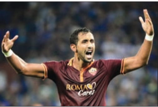
النادي البافاري ينافس مان يوناييتد وتشلسي على بنعطية

نكرت الصحف الألمانية أمس ان المدير الفني في بايرن ميونيخ بطل السدوري الألماني لكرة القدم في الموسم الماضي، ميكائيل ريسشكه موجود في روما من أجل ضم مدافع نادي العاصمة الإيطالية المغربي مهدي بنعطية لسد الفراغ الناجم عن إصابة الإسباني خافي مارتينيز.