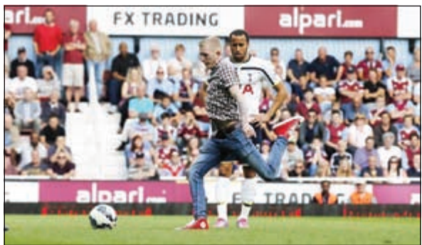
مشجع وست هام يسدد الكرة من أمام لاعب توتنهام

كانت الكوميديا والإثارة العنوان الأبرز لبعض المباريات الأوروبية سواء في الدوري الإنجليزي الممتاز أو المباريات الودية، بعضها كان مضحكاً وبعضها الآخر كان على النقيض كاد يتسبب في كارثة.