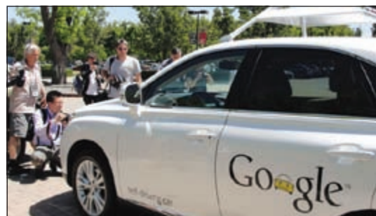
سيارة غوغل من دون سائق أثناء التجربة

الاسم الفني الذي يستخدمه دوجوف الأيمركي روسي المولد لوصف السيارات القادرة على قيادة نفسها. ويقول دوجوف (36 عاماً) إن البرنامج قد لا يوتي ثماره قبل سنوات ومن ثم فإن غوغل لا تكشف عن أي خطط تجارية للسيارة التي تسير دون سائق إن كانت هناك خطة. وكان دوجوف قام برحلة في الأونة الأخيرة بوحدة من هذه السيارات وسار بها مسافة 725 كيلومترا من وادي السيليكون حتى تامو ثم عاد ثانية. وخلال جولة تجربة السيارة التي استغرقت 25 دقيقة كان