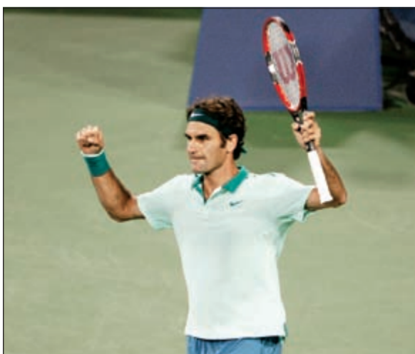
«الماسترز» روجيه فيدرر يواصل انطلاقته الرائعة في البطولة

وحقق فيدرر (33 عاماً) المصنف ثالثاً عالمياً رهاña 5 انتصارات في مواجهاته السابقة مع راونيتش. وقال فيدرر المتوج خمس مرات في سينسيناتي أخراها في 2012 وهو اللقب الأخير له في بطولات الماسترز: «بدأت مباراتي جيداً، ضربت الكرة بشكل صحيح وكنت أشرس منه في تبادل الكرات». وهذا الفوز الرقم 302 لفيدرر في بطولات الماسترز ألف نقطة.