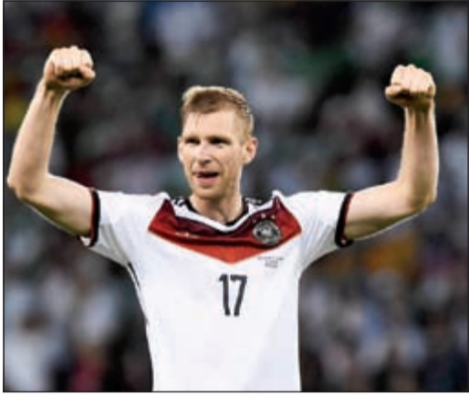
مرتيساكر على خطى لام وكلوze في الاعتزال دوليا

انضم المدافع بير مرتيساكر الى القائد السابق فيليب لام والهداف التاريخي ميروسلاف كلوزه بالاعتزال دوليا مع منتخب ألمانيا لكرة القدم بعد التوقيع بلفظ موندبول البرازيل 2014، معربا عن نيته التركيز على الفوز بدوري أبطال أوروبا مع فريقه أرسنال الإنجليزي. وقال مرتيساكر (29 عاما و104 مباريات دولية) ان حلمه الآن ينصب على مساعدة فريق «المدفعية» باحراز لقب الدوري الإنجليزي ايضا: «أردت ان اكون من يقرر موعد طي هذه الصفحة من مسيرتي الدولية». واضاف اللاعب الفارع الطول لصحيفة «سودويتشي تسابوتونغ» في مقابلة صحافية: «كأس العالم كانت نهاية ذهبية لفضل 8 اسابيع في حياتنا». وتابع: «الآن أريد الفوز بالدوري الانكليزي مع ارسنال ومحاولة الفوز ايضا في دوري الابطال».