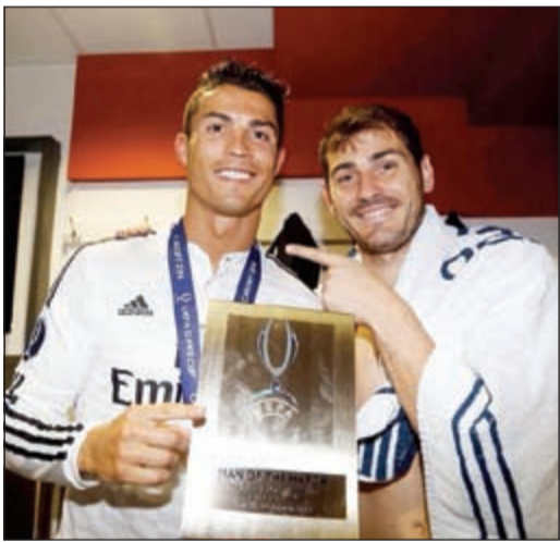
رونالدو يدافع عن تراجع مستوى كاسياس في الآونة الأخيرة

دافع كريستيانو رونالدو مهاجم ريال مدريد الإسباني عن زميله إيكير كاسياس حارس مرمى الريال والذي تعرض لانتقادات في الآونة الأخيرة بسبب تراجع مستواه بشكل ملحوظ. وقال رونالدو في تصريحات نقلها موقع «غول» العالمي: «إيكير لا يزال على الطراز العالمي وهو أحد أفضل الحراس في العالم».