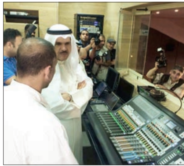
..وفي غرفة كنترول المسرح