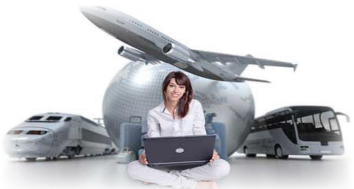
مواقع الكترونية مميزة تساعد على التخطيط للسفر لكل الطبقات الاجتماعية بعرض صفقات مغرية