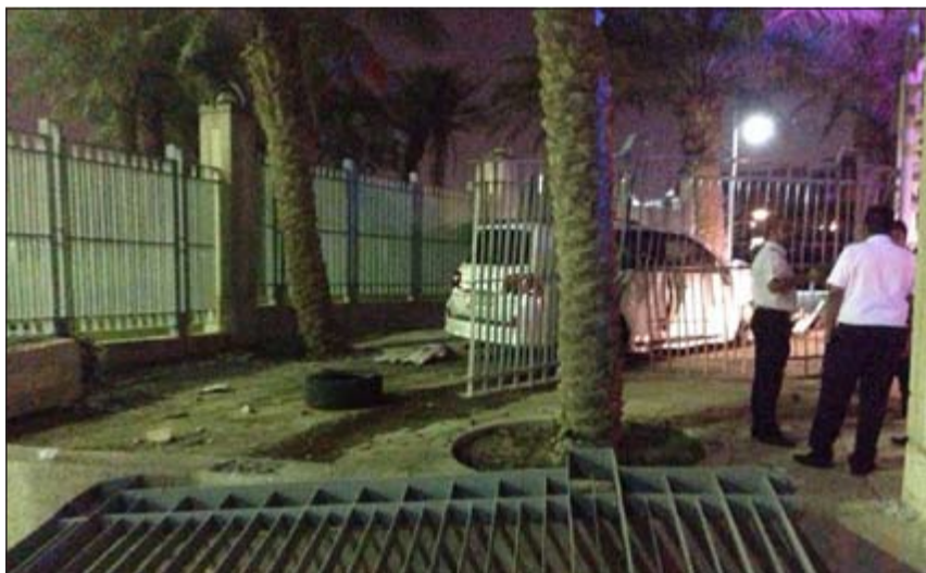
حراس أمن المؤسسة يحيطون بالسيارة المقتحمة

القبض عليهما وقاموا بإبلاغ غرفة العمليات لتحضّر دورية أمنية تابعة لمخفر الشامية، وبالتدقيق على بيانات الشخصين تبين أنهما مواطنان الاول (36 عاما) والثاني (22 عاما) وكانا بحالة غير طبيعية، وكانت السيارة بقيادة المواطن الاول الذي أصيب في وجهه من جراء الحادث، وعليه تم نقلهما الى مخفر الشامية وإحالتهم الى مكتب أمن الدولة لمزيد من التحقيق. وأفاد المصدر بأن حراس الأمن عندما توجهوا لإلقاء القبض على المواطنين بعد اقتحامهما محيط المبنى، قال أحدهما لحرس الأمن «وخروا عني لأرميكم»، رغم أنه لم يكن يحمل سلاحا.