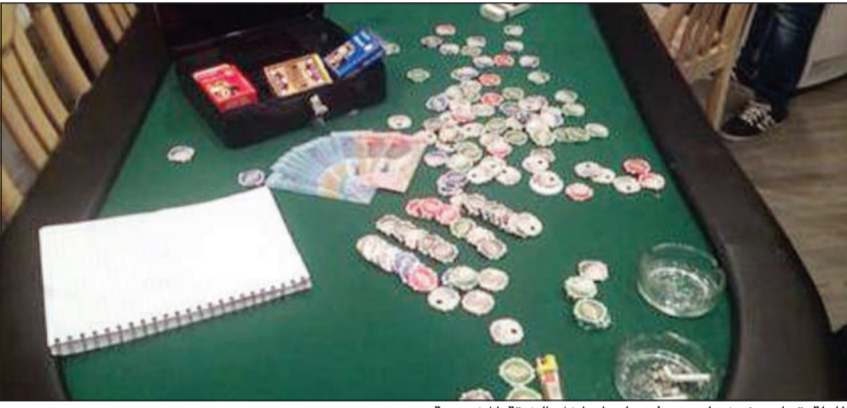
طاولة قمار وفيش لعب عثر عليها داخل الشقة المشبوهة

الشرهان بجمع التحريات عنها وعن من يدير هذه الشقة، وأضاف المصدر ان رجال المباحث وبعد جمع كل التحريات قاموا بمداومة الشقة بعد استصدار إذن نيابي وقاموا بإلقاء القبض على 12 شخصا بداخلها بينهم صاحب الشقة وموزع ورق «ديبلر» والبقية اتضح أنهم من الزبائن الدائمين للشقة.