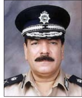
اللواء عبدالفتاح العلي

والدهما 45 عاما هو من أطلق النار على والدتهما وأنه وبعد أن أمطرها بثلاث رصاصات من مسدسه وجه فوهة المسدس إلى رأسه وأطلق النار ليلقى مصرعه فورا. وقال المصدر ان دوريات أمن توجهت إلى مستشفى الفروانية ودوريات أخرى ومعها دوريات مباحث وفرقة من الأدلة الجنائية وسيارات إسعاف توجهت إلى منزل المواطن المنتحر وكان على رأس القوة الوكيل المساعد لشؤون الأمن العام اللواء عبدالفتاح العلي وتم العثور على المواطن مطلق النار مضرجا في دمائه وسط صالة منزله وعثر بجانبه على مسدس (7 ملم) المستخدم في إطلاق النار، وبفحص رجال الإسعاف للمواطن تبين أنه فارق الحياة متأثرا بجرحه. وأضاف المصدر أنه