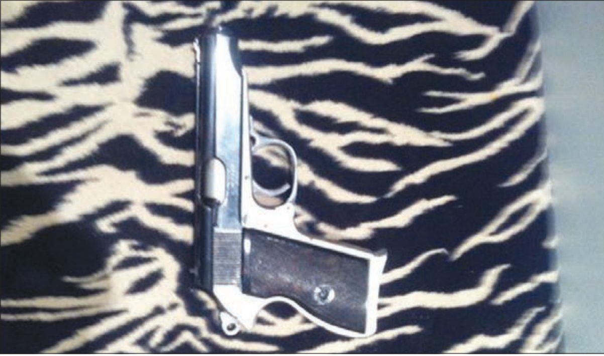
السلاح المستخدم في الجريمة

والدهما 45 عاما هو من أطلق النار على والدتهما وأنه وبعد أن أمطرها بثلاث رصاصات من مسدسه وجه فوهة المسدس إلى رأسه وأطلق النار ليلقى مصرعه فورا. وقال المصدر ان دوريات أمن توجهت إلى مستشفى الفروانية ودوريات أخرى ومعها دوريات مباحث وفرقة من الأدلة الجنائية وسيارات إسعاف توجهت إلى منزل المواطن المنتحر وكان على رأس القوة الوكيل المساعد لشؤون الأمن العام اللواء عبدالفتاح العلي وتم العثور على المواطن مطلق النار مضرجا في دمائه وسط صالة منزله وعثر بجانبه على مسدس (7 ملم) المستخدم في إطلاق النار، وبفحص رجال الإسعاف للمواطن تبين أنه فارق الحياة متأثرا بجرحه. وأضاف المصدر أنه