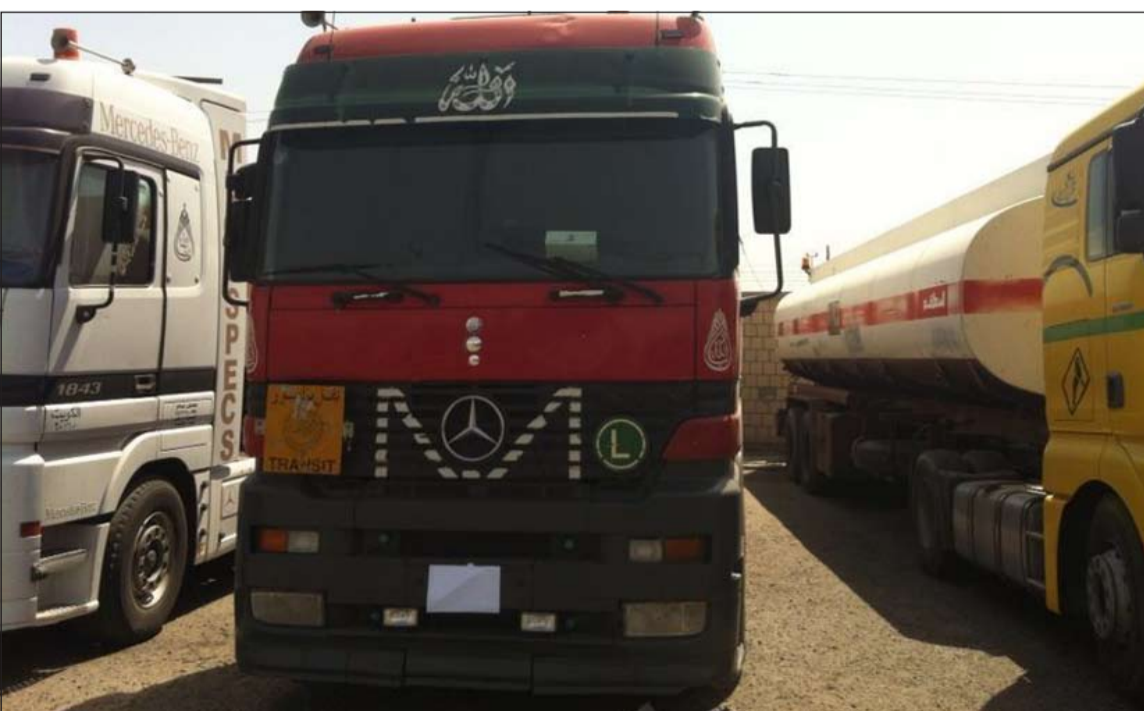
الشاحنات الثلاث المضبوطة في محاولة تهريب المشتقات البترولية