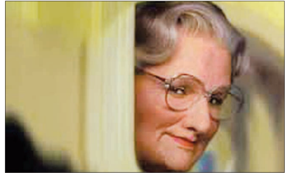
لقطة من فيلم بابا الشغالة

برسم البيع لأنه لم يعد قادراً على مصاريفه. السجلات العامة لأملك وويليامز تظهر أن لها قيمة عالية. فقصره في وادي نابا الذي يقع على أرض مساحتها 653 هكتارا، ويدعى «فيلا سورييسو»، وترجمتها «فيلا الإيتسامات»، معروض للبيع منذ شهر أبريل الماضي ومطلوب فيه 29,9 مليون دولار.