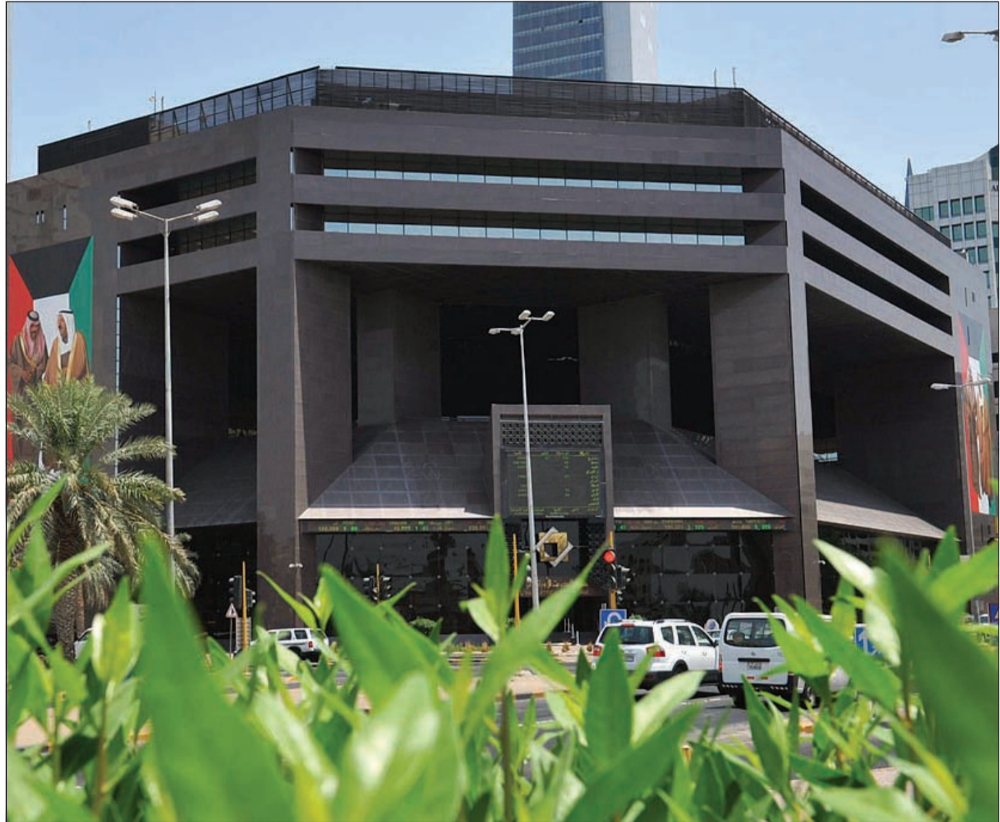
بين الورد والشوك يبدو أن الشركات المدرجة في البورصة الكويتية عانت في النصف الأول إذ جاءت نتائجها متواضعة جدا في وقت تتفاهل فيه البورصة بأخبار الاستحواذات والصفقات المياريبة التي مازالت حتى الآن بعيدة الخيال (قاسم باشا)