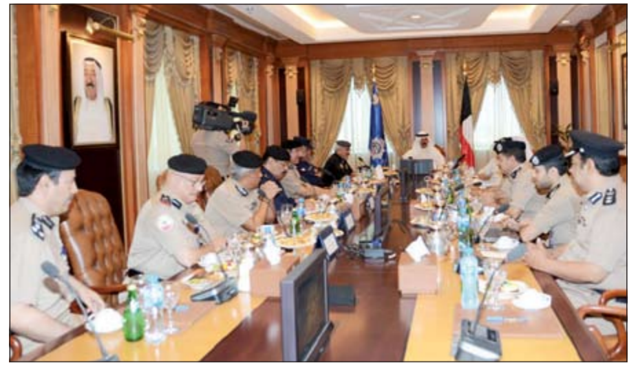
الشيخ محمد الخالد مترثسا اجتماع الوكلاء المساعدين بحضور اللواء محمود الدوسري

سجلت قضية في مخفر الفحيحيل تحت عنوان الاتلاف المتعمد والسب، وجاء تسجيل القضية بعد أن تقدم وأفد مصري إلى المخفر، وقال أن أشخاصا لا يعرفهم كانوا على متن مركبة يابانية 2011 دخلوا مغسلة سيارات وأحدثوا بها تلفيات وسبوا العاملين وهربوا إلى جهة غير معلومة قبل وصول رجال الأمن.