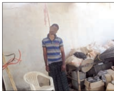
الآسيوي انتحر في المزرعة