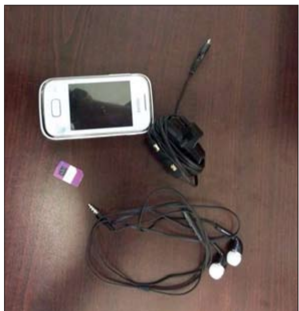
الشاحن والهاتف اخفيا في كربون لمنع ظهورهما على اجهزة التفتيش