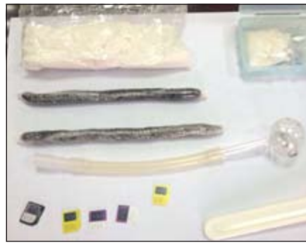
المضبوطات احيلت إلى «المكافحة»