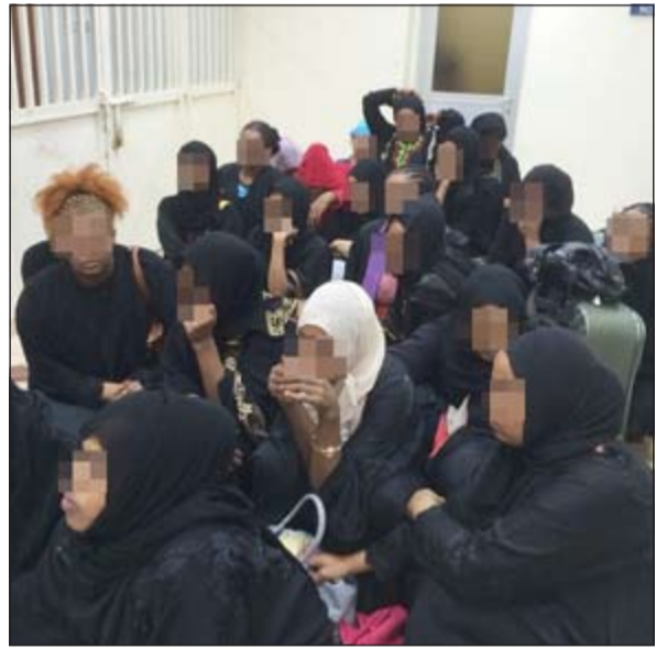
أغلب المضيفات في الوكر من المتغيبات

وفي التفاصيل ان بلاغا ورد الى مديرية امن الجهراء من وافدة تغيب باختطافها واحتجازها في احد اوكار بناية في منطقة العمائر الاستثمارية، فتم اخطار اللواء العلي الذي امر بتشكيل قوة واخطار النيابة ورجال المباحث، فتم التنسيق ومدهمة العمارة، وتم ضبط الاشخاص الذين حاولوا الفرار الا انهم لم ينجحوا، وشارك