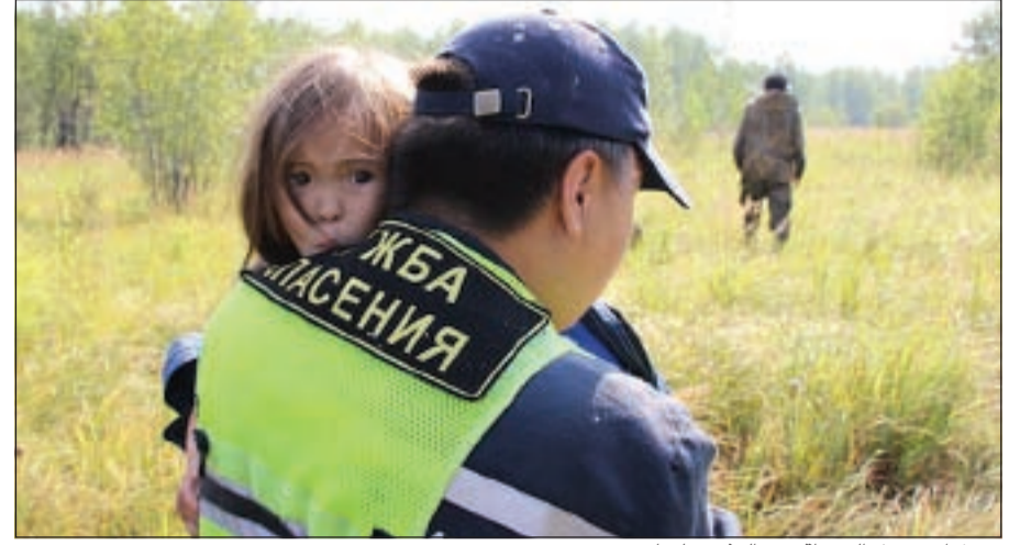
بين ذراعي رجل الشرطة فور العثور عليها

فاطلقت السلطات المحلية أبحاثاً واسعة النطاق شارك فيها أكثر من مئة متطوع لأكثر من أسبوع. وعندما فقد رجال الإنقاذ والأهل الأمل في العثور على الطفلة، عاد جروها إلى منزل والديها وساعدهم في العثور عليها.