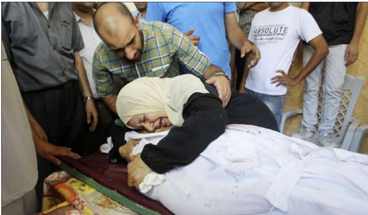
سيدة فلسطينية تبكي احد اقاربها الذي قضى خلال تفكيك قذيفة اسرائيلية بغزة امس

ببوره، أعلن المتحدث الرسمي باسم وزارة الداخلية اللواء هاني عبداللطيف رفع حالة الاستعداد إلى درجاتها القصوى والاستنفار الأمني، لبدء تنفيذ خطة تأمين الشارع المصري بكل المحافظات على مستوى الجمهورية، والتصدي لأي تهديدات لترويع المواطنين في اليوم. وأكد اللواء عبداللطيف في تصريح خاص لوكالة أنباء الشرق الأوسط أن رجال الشرطة سيحافظون على مستوى الأمن، فضلا عن مضاعفة الخدمات الأمنية المكلفة بتأمين السجون وتسليحها بالأسلحة الثقيلة لمواجهة أي محاولة للاعتداء عليها.