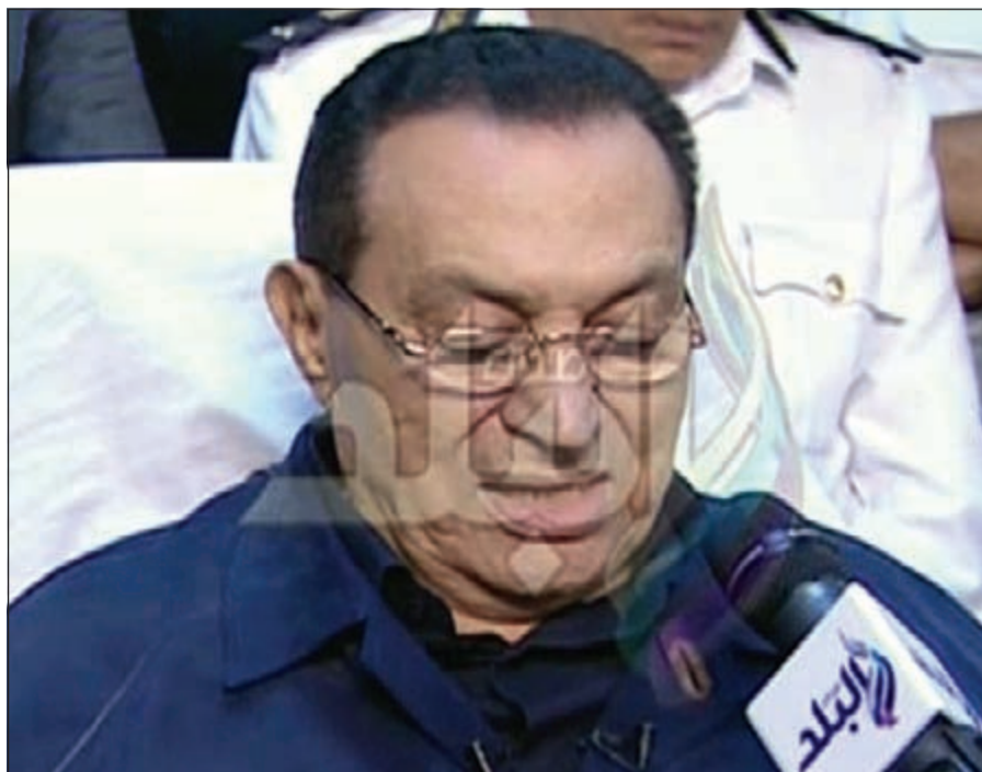
الرئيس المصري الاسبق حسني مبارك خلال تعقيبه على تهم قتل المتظاهرين امام جنابيات القاهرة، امس

وفي ختام جلسة أمس، حددت هيئة المحكمة جلسة السبت 27 سبتمبر القادم للنطق بالحكم في القضية، التي بدأت أولى جلساتها في 11 مايو 2013.