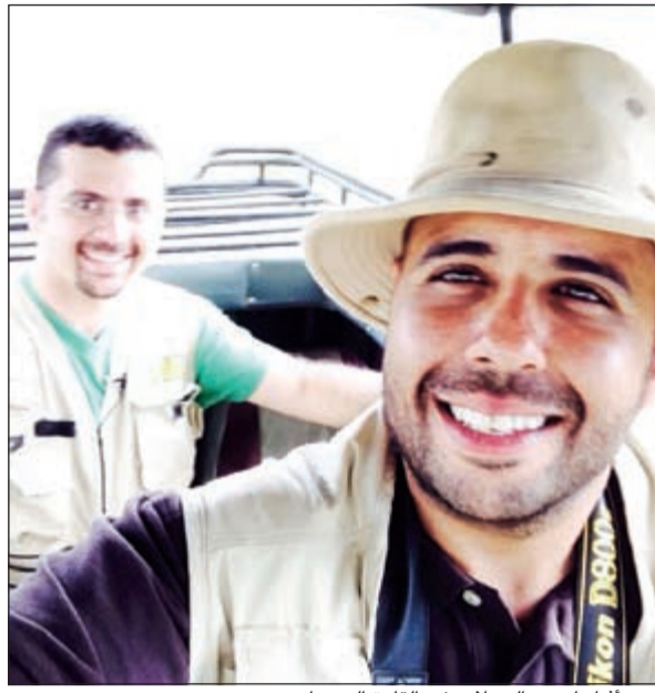
... وأثناء إحدى الرحلات في القارة السمراء

اللازمة خاصة ان برنامج «سفاري» الذي عرض عبر شاشة تلفزيون «الوطن» قبل رمضان حصد العديد من ردود الأفعال الإيجابية في الكويت وخارجها، وقال: ما تردد مؤخرا عن انتشار «إيبولا» وغيره من الأمراض سبق ان ظهر لفترة واختفى دون ان نشعر، وفكرة جزء ثان من البرنامج مطروحة بقوة، مع تطويرها والتوسع فيها بشكل أكبر حتى لو كان تسجيل الحلقات خارج القارة السمراء والتوجه الى بقاع أخرى فسي العالم بالإمكان توثيق الحياة البرية أو حتى البحرية فيها. وأضاف القناعي: أنا وأني طاقم عمل سيعمل معي في المستقبل سنكون حريصين