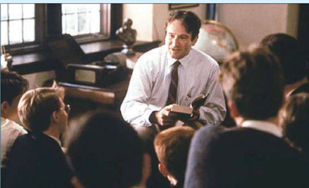
لقطة من فيلم روبن وليامز الأشهر «جمعية الشعراء الموتى»