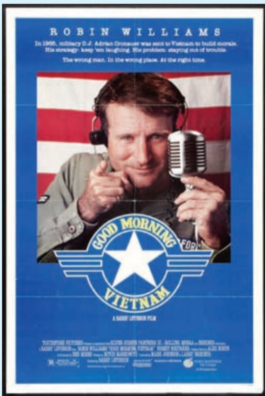
ملصق فيلم «صباح الخير يا فيتنام»