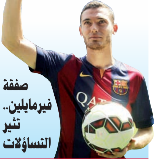
صفقة فيرمالين.. تثير التساؤلات

أصبح روما الإيطالي أول ناد بالدرجة الأولى في إيطاليا يمتلكه بالكامل مستثمرون أجانب، حسبما أعلنت إدارة النادي في بيان لها. وقام بنك «يوني كريديت» الإيطالي ببيع حصته التي تبلغ 31% من مجموع الأسهم إلى مجموعة استثمارية أميركية يديرها رئيس النادي الحالي جيمس بالوتا. وأشار البيان إلى أن البنك الإيطالي حصل على 33 مليون يورو مقابل بيع حصته المذكورة ليصبح روما مملوكا بالكامل للمجموعة الاستثمارية الأميركية.