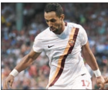
المغربي الصلب بنعطية في طريقه إلى لندن

أجمعت تقارير صحافية إنجليزية على أن تشلسي بات هو الأقرب للظفر بخدمات قلب دفاع روما المميز مهدي بنعطية مقابل 30 مليون إسترليني، وهو المبلغ الذي اشترطه روما للتخلي عن خدمات اللاعب. وكان البرتغالي جوزيه مورينيو المدير الفني للبلوز، قد أكد الشهر الماضي أن سوق ناديه الصيفي قد انتهى، لكن تشلسي دخل طرفا مع غريمه مان يونايتد على بنعطية، الذي يعد أحد أبرز الأسماء الرائجة في سوق الانتقالات الصيفي الحالي، وعلى ما يبدو فإن الأزرق اللندني هو من فاز بالسباق. إذ أكدت صحيفة الديلي ستار البريطانية واسعة الانتشار، أن تشلسي على وشك حسم الصفقة لصالحه مقابل 30 مليون إسترليني، بل إن مورينيو يسعى جاهدا لإغلاقها قبل مواجهة فريقه أمام بيرنلي يوم الاثنين المقبل في افتتاح الدوري الإنجليزي الممتاز.