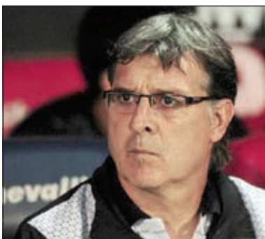
تاتا الأقرب لخلافة سابيللا

تكرت صحيفة «ماركا» من مدرب برشلونة السابق غيراردو تاتا مارتينو توصل لاتفاق مع الاتحاد الأرجنتيني لكرة القدم من أجل خلافة اليخاندرو سابيللا على رأس الإدارة الفنية للتانغو. وسيوقع تاتا مارتينو على عقد لـ 4 سنوات مع وصيف بطل العالم، ومنذ منتصف شهر يوليو وعدة مصادر كشفت أن مارتينو هو المرشح الأوفر حظا لخلافة سابيللا. وكان أحد أعضاء الاتحاد الباراغواياني قال إن تاتا مارتينو لديه اتفاق مبدئي مع الاتحاد الأرجنتيني، وأراد الاتحاد الباراغواياني إعادة مارتينو لقيادة منتخب باراجواي بعد أن قادهم في مونديال 2010 بجنوب أفريقيا. وسيشرف مرة أخرى مارتينو على تدريب خافيير ماسكرانو وليو ميسي اللذين عملا تحت أوامره في برشلونة الموسم الماضي.