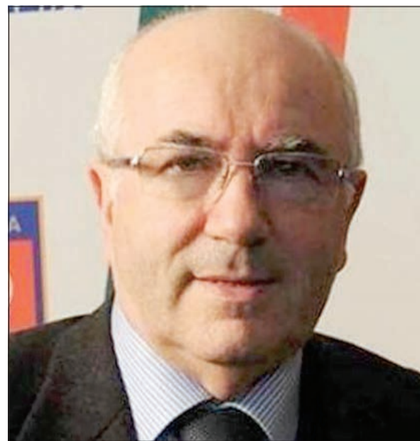
هل ينفذ تافيكيو «الأزوري» الجريح؟

يلعب أساسيا». وقصد تافيكيو بهذا المثل تشبيه لاعب وسط منتخب فرنسا وفريق يوفنتوس بطل إيطاليا بالقرود، ما أثار جدلا حادا على أعلى المستويات، لكنه اعتذر وأكد أنه لا يستهدف أحدا، وأصر على ترشيح نفسه رغم الدعوات العديدة إلى سحب هذا الترشيح. وجاء الخروج المخزي لـ «الأزوري» من كأس العالم الأخيرة ليبدد ناقوس الخطر معلنا أنه حان وقت التغيير داخل الاتحاد الإيطالي والمسؤولين عن الكرة بالبلاد فاستقال إبيتي من رئاسة اتحاد كرة القدم وتمت الدعوة لانتخاب رئيس. وترشح للرئاسة شخصان: الأول هو الشاب البيريتيني صاحب الطموح الكبير والخطة المحددة للخروج بإيطاليا من