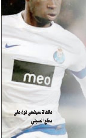
مانغالا سيضفي قوة على دفاع السيتي

أصبح المدافع الفرنسي الياكوم مانغالا ثاني أعلى مدافع في تاريخ كرة القدم، بعد إعلان مان سيتي التعاقد معه من صفوف بورتو البرتغالي. «بطل البريميرليغ» لم يكشف عن قيمة الصفقة، لكن الصحافة العالمية متفقة على أنه دفع ما يقارب 32 مليون جنيه إسترليني من أجل تعزيز أضعف خطوطه، ليصبح بالتالي ثاني أعلى مدافع في تاريخ كرة القدم بعد ديفيد لوز الذي انتقل هذا الصيف إلى باريس سان جرمان مقابل 40 مليون جنيه إسترليني (صفقة لوز قد ترتفع إلى 50 مليون جنيه إسترليني بناء على معطيات أانه وفوزه بالألقاب مع النادي الفرنسي). وأصبح مانغالا أيضا أعلى مدافع يتم شراؤه من ناد إنجليزي، حيث تغلب على الرقم السابق الذي حمله ريو فيردناند طويلا عندما انتقل من ليدز يونايتد عام 2002 إلى مان يونايتد مقابل 30 مليون إسترليني.