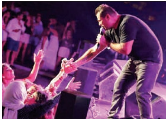
عمرو دياب في الحفل

بين النجمين راغب علامة، الذي يصدر ألبومه الجديد «حبيب ضحكاتي»، والنجم عمرو دياب، الذي سيكون حاضرا عبر الرنات الهاتفية