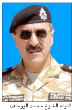
اللواء الشيخ محمد اليوسف

المفعول، وذلك على كل طرايد الزهة اعتباراً من يوم الجمعة الموافق المقبل وأنه سيتم تدوين مخالفة عدم حمل رخصة نوخذة أثناء الإبحار ويتم سحب دفتر الطراد في حال المخالفة، مشيراً إلى أن شرط حمل الرخصة ينطبق على قائد الطراد «النوخذة» وليس كل من على متنه. وأضاف وكيل وزارة الداخلية المساعد لشؤون أمن الصدور أن إدارة الإعلام الأمني ستبدأ بحملة توعوية لمرتادي البحر من مواطنين ومقيمين للتعريف بجميع النواحي الأمنية الخاصة بسلامة مرتادي البحر بالإضافة إلى حملة خاصة بقرار حمل رخصة قيادة الطراد «للبلسن البحري»، مؤكداً في الوقت ذاته أن من يخالف ذلك سيرعرض نفسه للمساءلة القانونية وسحب دفتر الطراد. ودعا اللواء اليوسف مرتادي البحر من المواطنين والمقيمين أصحاب الطرادات والسفن الصغيرة إلى الحصول على رخصة «نوخذة ب» والتسجيل لدى إدارة المسح البحري بوزارة المواصلات وفقاً للإجراءات القانونية قبل 15 الجاري لتفادي التعرض إلى المخالفة والمساءلة القانونية، مشيراً إلى أن إدارة المسح البحري التابعة لوزارة المواصلات قد أتمت الاستعدادات اللازمة لاستقبال كل طلبات الحصول على رخصة «النوخذة ب» قبل التاريخ المحدد تنفيذاً للقرار الوزاري رقم 3644 لعام 2013 المعني بحظر أي شخص يقود طراد دون