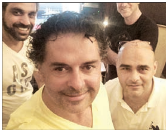
راغب علامة أثناء تسجيل أغنيات اليوم الجديد