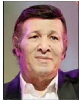
الراحل سعيد صالح

لم يبق من عائلة رمضان السكري إلا الأب والأم والأبنة فقط، بعد رحيل الابن الأكبر سلطان والسذي كان يقدم شخصيته الفنان سعيد صالح في مسرحية «العيال كبرت» والتي مر على تقديمها ما يقرب من 35 عاما، ولكنها مازالت تعيش داخل وجداننا بكل ما تحمله من ضحكات رسمت على وجوهنا سعادة لم نشعر بها مع غيرها من أعمال. وتحدثت الفنانة نادية شكري والتي عرفت باسم «سوسو»، عن كواليس المسرحية، وعن كيف كان يتعامل كبار النجوم مع بعضهم، وأهم المواقف التي جمعتهم معا، وقالت: «أتذكر دائما موقفه معي في مصالحتي