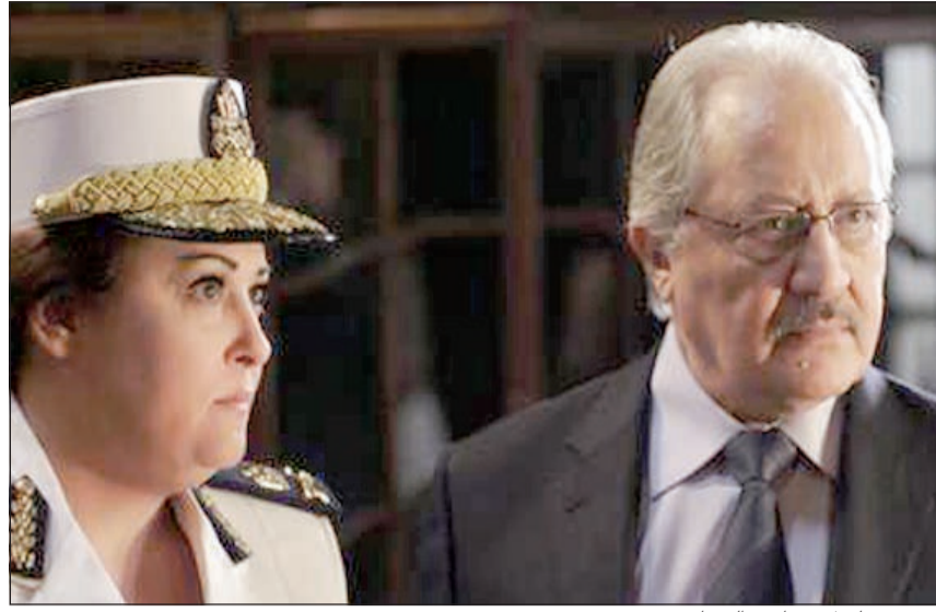
.. في مسلسل «صاحب السعادة»

ممثلة خليجية صابقتها غيرة من ممثلة عربية بعد ما منحها احد المخرجين جدامها مع انه هالمخرج ما اشتغل معاها بس عجبه أدائها في مسلسلها الرمضاني الأخير.. سولف حريم!