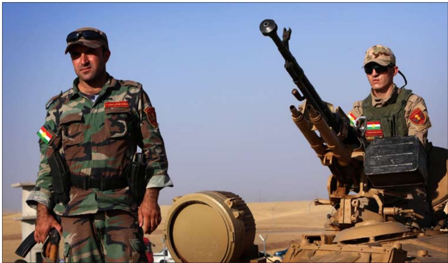
عصران من البشمركة الكردية خلال تواجدهما على نقطة حدودية بالقرب من اربيل

وأجبر الطيران الإرهابيين المسلحين على الانسحاب من «دوميز» مع استمرار القصف الجوي لمواقعهم واليائهم. في نفس السياق، ذكر المركز، ان قصفا جويا للجيش العراقي أسفر عن تدمير 4 عجلات من سيارة همر، تقودها عناصر تنظيم «داعش» الإرهابي، في