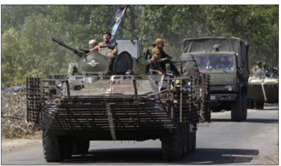
وحدات من الجيش الأوكراني خلال دخولها الى دونيتسك امس

وأوضح ان الرئيس الأوكراني بترو بوروشنكو «وقف هذا الاستفزاز عبر القنوات الدبلوماسية، بعدما تشاور هاتفا مع وزير الخارجية الأميركي جون كيري. كذلك، تشاور وزير الخارجية الأوكراني بافلو كليمين مع نظيره الروسي سيرغي لافروف الذي أكد انه سيتم وقف القافلة، وفق تشالي.