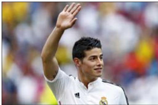
شركة بيريز المستفيد الأكبر من هداف المونديال

على غرار الأرباح الاقتصادية لريال مدريد من صفقة الكولومبي خاميس رودريغيز، أيضاً رئيس ريال مدريد فلورينتينو بيريز كان الربح الأكبر من هذه الصفقة، حيث ذكرت وسائل الإعلام الإسبانية أن شركة بيريز المختصة في البناء توصلت لاتفاق ضخم مع الحكومة الكولومبية. ووفقاً للصحيفة الاقتصادية «إكسبانسيفن» فإن شركة فلورينتينو للبناء «إي سي إس» ستقوم بشراكة مع الحكومة الكولومبية لبناء طريق سريع في المحيط الهادئ وهو مشروع تقدر قيمته بأكثر من 692 مليون يورو. وأشار المصدر نفسه إلى أن المشروع سيعتمد على جسور ومن المتوقع أن يبدأ العمل الشهر المقبل وسيستمر لمدة خمس سنوات. وليس هذا المشروع الوحيد، بل أيضاً ستقوم شركة رئيس ريال مدريد «إي سي إس» بشراكة مع شركة كولومبية للبناء «أكسيونا» بتصميم وبناء وتشغيل وصيانة المشروع لاستعادة الملاحة في نهر ماجدالينا (المر المائي الرئيسي في كولومبيا) وتقدر قيمة هذا المشروع بحوالي 945 مليون يورو.