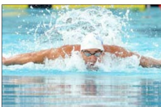
فيلبس يسبح إلى العوذة بقوة

خسر السباح الأميركي مايكل فيلبس، الرياضي الأكثر تتويجاً في تاريخ الألعاب الأولمبية، في سباق 100 م فرائشة في بطولة الولايات المتحدة المقامة في أيرفاين، إذ تخلف بفارق 1% من الثانية عن توم شيلدن. وسجل فيلبس العائد بعد اعتزال دام 20 شهراً 51,30 ثانية مقابل 51,29 لشيلدن، علماً بأنه حقق 51,17 ثانية في التتابع وهو أفضل وقت هذه السنة. وحجز فيلبس تذكرته الأولى للألعاب الهادئ في نهاية الشهر في استراليا والمؤهلة إلى بطولة العالم، إذ توّهل الاربعة الأوائل. وكان فيلبس (29 عاماً) حقق المركز السابع في سباق 100 م حرة الأربعة الماضي. وقال فيلبس: «أنا بحاجة لتعارين إضافية للحصول على تحمل إضافي». وكان فيلبس (22 ميدالية أولمبية 18 منها ذهبية)، اعتزل مباشرة بعد أولمبياد لندن 2012، لكنه عاد عن اعتزاله وبدأ المشاركة في المنافسات في أبريل الماضي.