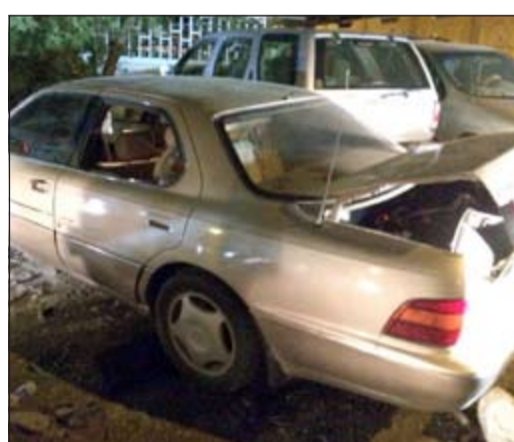
المطارة اسفرت عن اضرار مركبة المتعاطين

وقال مصدر ان أمن الفروانية أوقف الوافد، وكان بحوزته الخمور المحلية وبالاستعلام تبين انه مطلوب.