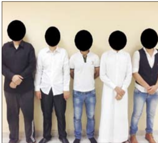
السوريون الخمسة في المباحث الجنائية

قامت وزارة الداخلية بتشكيل لجنة أمنية برئاسة الإدارة العامة لمباحث الهجرة وبمشاركة عدد من الإدارات المعنية للتحقيق في قضية المنسوب المصري الذي قام بتزوير أوراق التأمينات لصالح