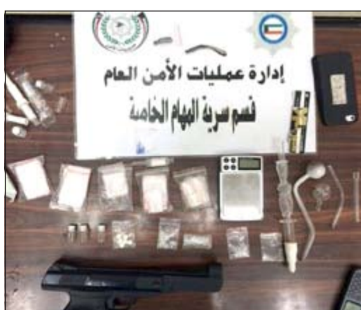
المضبوطات أحيلت إلى المكافحة

الاشتباه في مركبة بداخلها 3 أشخاص وعندما تم الطلب من قائد المركبة التوقف قام الشخص بزيادة سرعة السيارة والهروب وخلال المطاردة قام السائق بمحاولة إعاقة ضبطه من خلال الاصطدام بالدوريات لإيقافها عن المطاردة ولكن رجال الأمن سكرنا عليه الطريق فنزل من كان