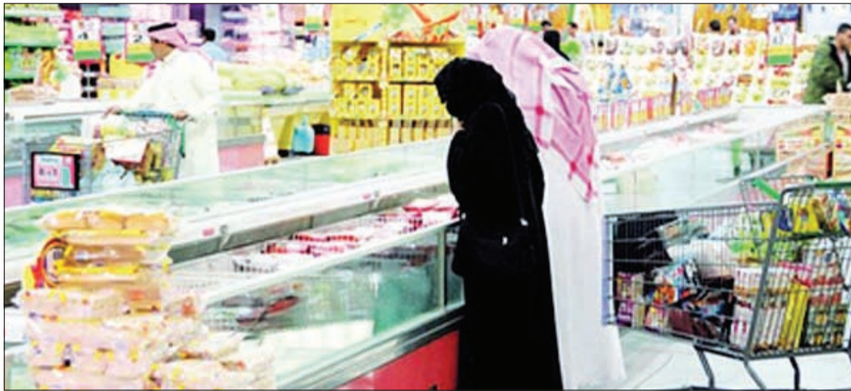
اعتدال لبعض أسعار المواد الغذائية