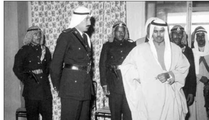
سمو الشيخ نواف الاحمد في يناير 1963 في أول انتخابات برلمانية