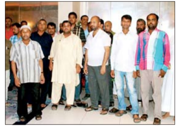
صورة جماعية لعدد من العمال عقب تناول الإفطار