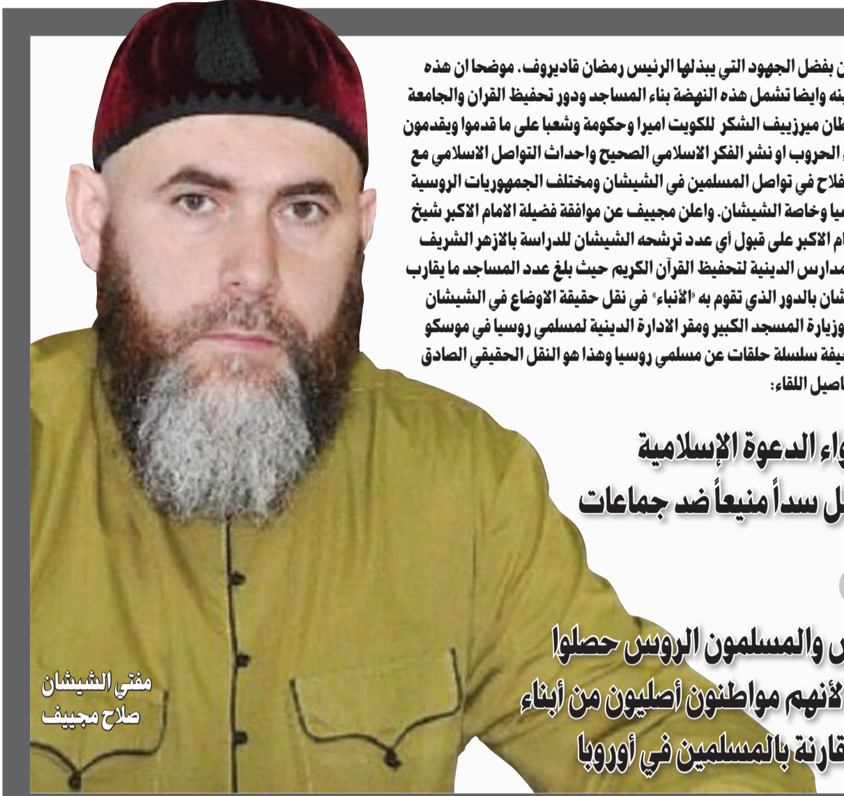
مفتي الشيشان صلاح مجيب