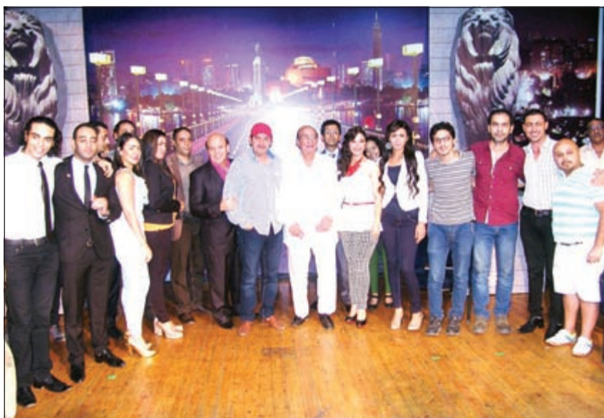
جلال الشراوي يتوسط فريق المسرحية

في الوقت الذي يراها فيه الكثير «أيقونة» في الموضة والجمال، كشفت الفنانة اللبنانية إليسا عن أنها لا تحفظ بأي مستحضر تجميل في حقيبتها خلال حياتها اليومية، لافتة إلى أنها لا تصحح ماكياجها على امتداد النهار، واعترفت إليسا بأنها أصبحت أكثر جرأة في ملابسها، وقالت: بت أكثر جرأة وهذا يعود إلى مسنقة الملابس التي تتساعدي، لم أعد أخاف من الأسوان والعلامات التجارية الجديدة التي لم