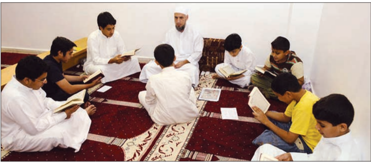
من أنشطة غراس

● إذا كانت هناك فمة كلمة أوجهها في هذا المقام فهي الشكر الجزيل لكل من دعم مشاريع الغراس التي تغرس القرآن في نفوس الأجيال، والشكر كل الشكر لأهل الخير في الكويت على دعمهم وخيراتهم التي عرفوا بها، والشكر أيضا لكل من يعمل في هذا المشروع سواء الإشرافية وكذلك المحفظون والأقسام الفنية، والأجر العظيم لهم جميعا يوم القيامة إن شاء الله.