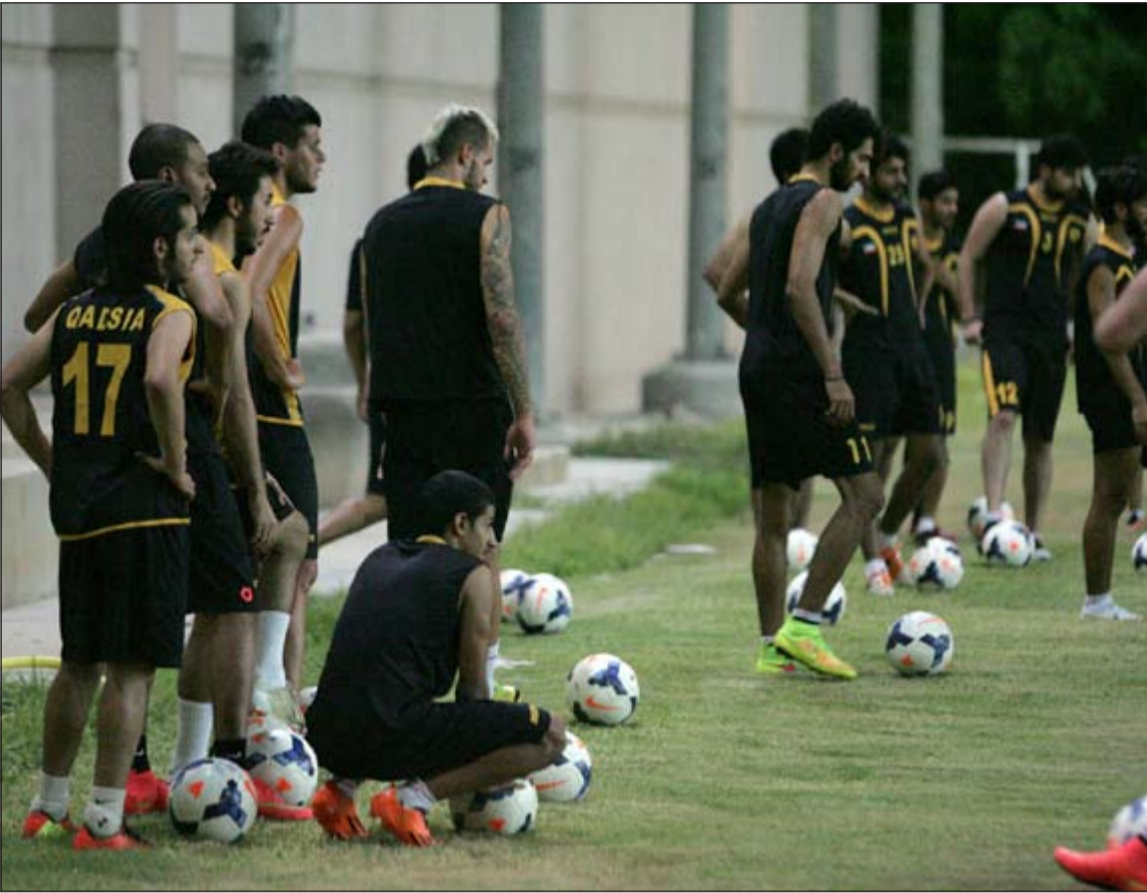
لاعب الأصفر يريدون مواصلة حصد الألقاب

17 لاعباً، حيث سيتديرون مع الفريق تدريباً واحداً قبل خوض أولى المباريات الرسمية وهي كأس السوبر الجاري أمام الكويت.