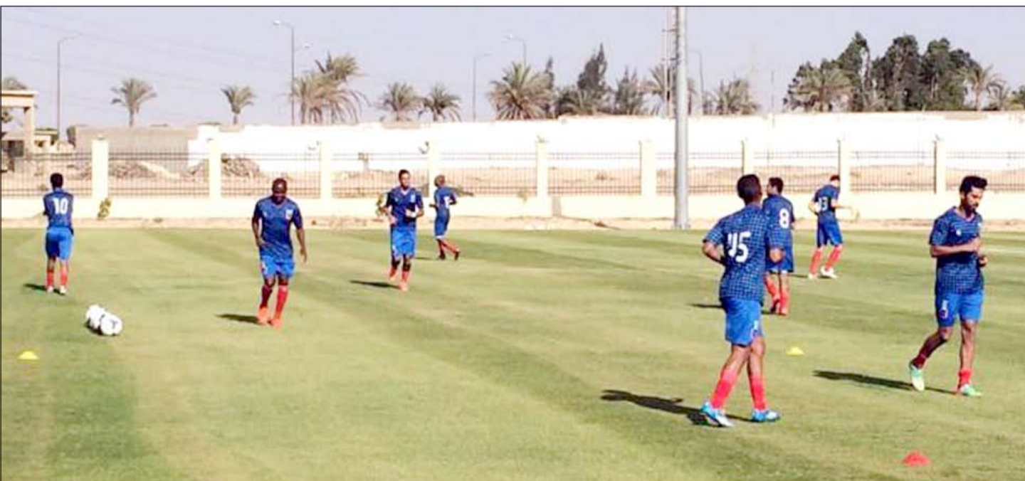
الأبيض يسمى إلى رفع معدل لياقة لاعبيه بصورة مميزة قبل مواجهة السوبر