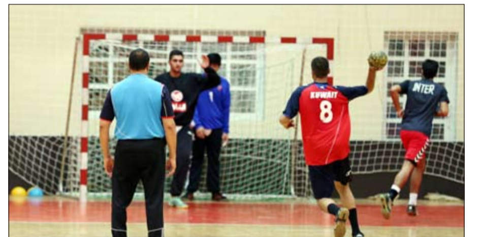
شباب يد الأزرق جاهزون لمواجهة إيران

من تحقيق تعادل مثير ونقطة ثمينة للغاية أمام منتخب قوي ومرشح للقب.