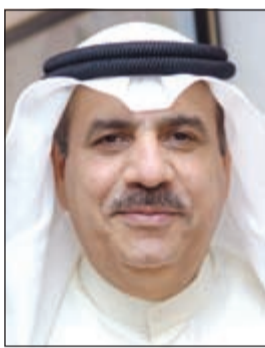
السفير محمد الرومي

من مجازر يومية ضد السكان العزل بمن فيهم الأطفال والنساء الامر الذي يتطلب سرعة تدخل المجتمع الدولي لوقف هذا العدوان. وبين الجهود التي تبذلها الكويت لمساعدة الشعب الفلسطيني ومن موقع ترؤسها للدورة الحالية للجنة العربية وبيصفتها رئيسة للجنة المنبثقة عن الاجتماع الوزاري لجامعة الدول العربية الذي عقد بمقر الامانة العامة للجامعة في 14 يوليو 2014 بدعوة من الكويت وبالتعاون مع اعضاء اللجنة حيث قامت بالتحرك السياسي مع الامم المتحدة واميتها العام وكذلك رئيس وعضء مجلس الامن الدولي والتواصل مع جميع