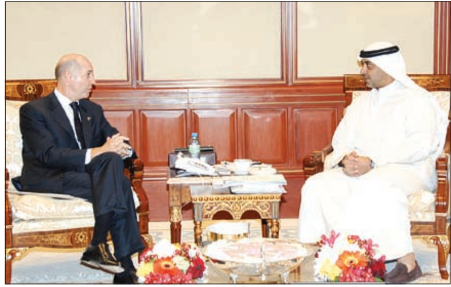
الشيخ محمد عبدالله خلال لقائه سفير جمهورية إيطاليا فابريزيو نيكوليتي

مع هذين البلدين الصديقين والتي تأتي في إطار المصالح المشتركة.