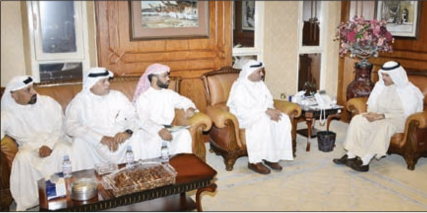
الشيخ سلمان الحمود خلال استقباله وفدا من فريق مجموعة سنيار التطوعية

للشيخ سلمان على ما تقدمه وزارة الاعلام من دعم لجهود الفريق منذ تأسيسه حتى الآن. مؤكداً التزامهم بمواصلة العمل التطوعي ابتغاء الأجر من الله وخدمة لبلادهم. وقام أعضاء الفريق بتقديم مجموعة من الكتب والأفلام التي توثق أعماله. كما استقبل وزير الاعلام ووزير الدولة لشؤون الشباب الشيخ سلمان الحمود أعضاء الجمعية الخيرية للاعاقه، حيث نقل البيان عن الشيخ سلمان تأكيده استمرار دعم وزارة الاعلام ووزارة الدولة لشؤون الشباب لجهودهم. وذكر البيان ان أعضاء الجمعية اعربوا عن شكرهم للحمود على جميع أنواع الدعم التي يقدمها للجمعية ورعاية