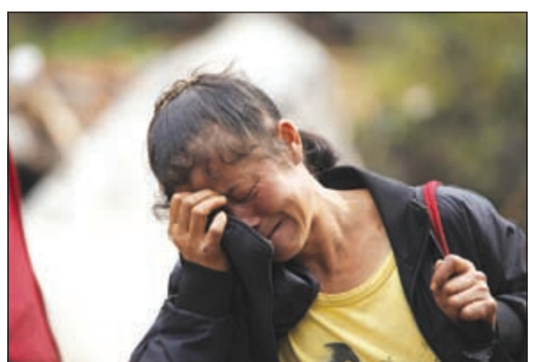
تبكي على عزيز فقته

ونقلت وكالة أنباء «الصين الجديدة» الرسمية عن ليو قوله إن هناك «نقصا حادا» في توافر فرق الإنقاذ الاحترافية والادوات، مشيرا إلى أنهم يجدون صعوبة في رفع الانقاض عن الطرق المسدودة.