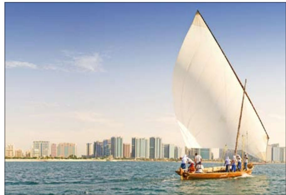
طلب قوي على السياحة في ابوظبي