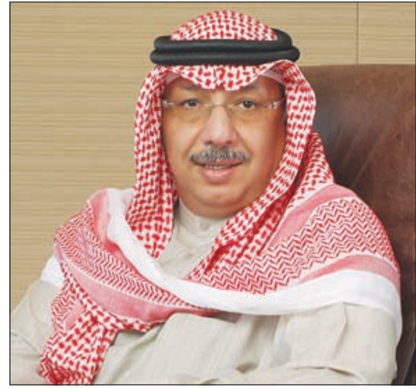
الشيخ محمد الجراج

أعلن رئيس مجلس ادارة بنك الكويت الدولي الشيخ محمد الجراج في بيان صحفي أن بنك الكويت الدولي قد حقق ارباحا صافية بلغت 8,9 ملايين دينار في نهاية النصف الأول من عام 2014 مقابل 6,0 ملايين دينار في نهاية يونيو 2013 اي بزيادة ملحوظة بلغت نسبها 48%، حيث بلغت الأرباح التشغيلية قبل اخذ المخصصات نحو 16,7 مليون دينار، مشيراً بهذا الخصوص إلى أن هذا النمو يعكس صورة مباشرة استمرار الاداء الجيد للبنك خلال عام 2014 في تنوع مصادر إيراداته، فقد ارتفعت