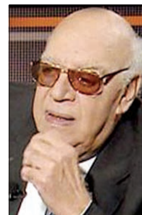
المؤلف المسرحي علي سالم

متأخرا لذلك لم يتمكن من حضور جنازة. وعاد الفنان المصري من فيلته بالساحل الشمالي إلى القاهرة، استعدادا