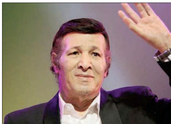
الراحل سعيد صالح