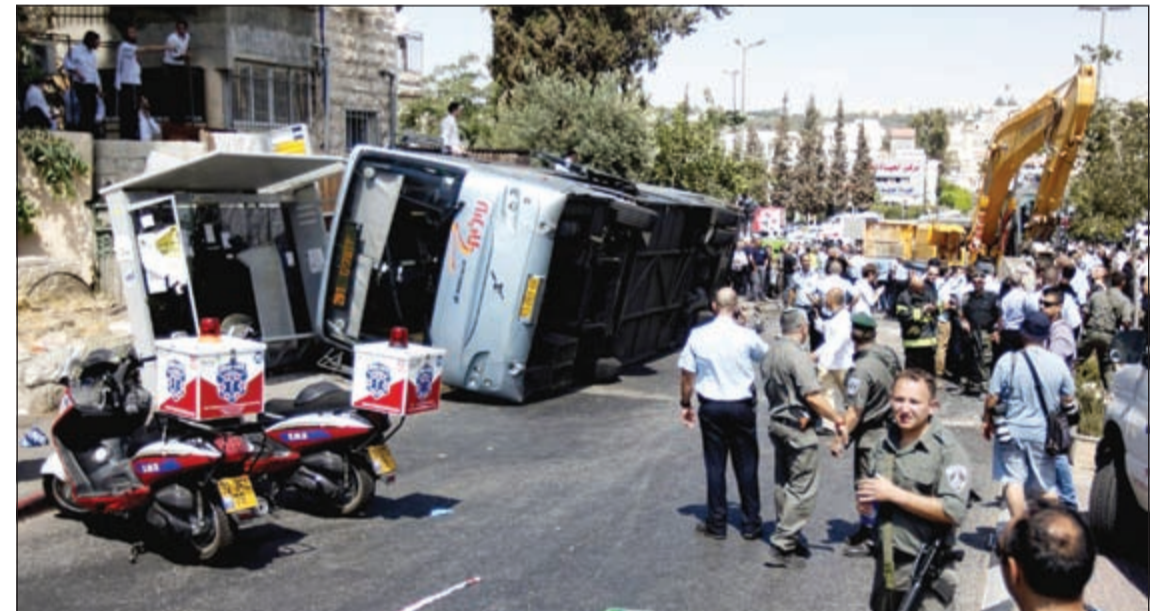
الشرطة الإسرائيلية خلال معاينة موقع مهاجمة الجرافة لحافلة المستوطنين بالقدس امس

إسرائيل تستأنف عدوانها على غزة حتى «استعادة الهدوء»