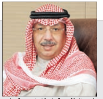
رئيس بنك الكويت الدولي الشيخ محمد الجراح

أرباح 'الدولي' تنمو 48% إلى 9 ملايين دينار 25 هل ينطلق مترو الكويت في 2017.. بـ 61 محطة؟ 24