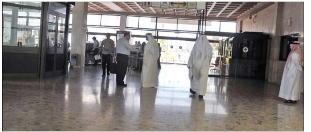
جانب من المراجعين في أول يوم دوام بعد العيد