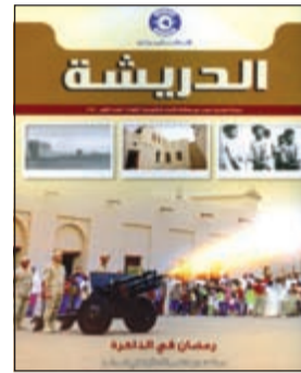
غلاف مجلة «الدريشة»

بأن تكون نافذة على كويت الماضي والحاضر واستشراف المستقبل بعين الفاحص الناقد. ويحرص القائمون على «الدريشة» أن يتضمن كل عدد قيمة أخلاقية تسلط الضوء على مشاكل المجتمع وتعمل على وضع الحلول المناسبة لها. وقد تمثلت القيمة الأولى لهذا العدد في مكافحة ظاهرة العنف في المجتمع الكويتي. وتميز العدد الأول بطابع رمضاني لترتزامن صدور «الدريشة» مع حلول شهر رمضان الكريم وبما يتناسب مع هذه المناسبة المباركة حيث فردت صفحات لموضوعات تتعلق بالشهر المبارك في كويت الماضي وما يسبقه من استعدادات